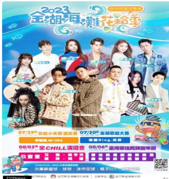
2023金湖海灘花蛤季即日起在金門成功出海口廣場盛大舉辦。