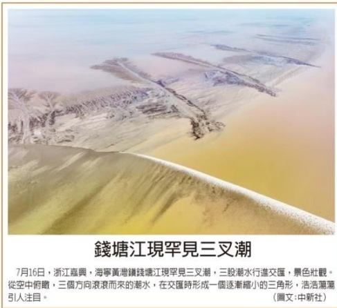
錢塘江現罕見三叉湖

當地地方沒有造血能力，海量基建投資的錢，要麼靠房地產靠地，要麼靠轉移支付，要麼靠發債。但現在哪一條路都不好走了，結果是搞出一些低效、重複的基建，還欠了大量的債務，債務風險不斷攀升。 評論表示，基建狂飆的時代已經結束了。但這不是壞事。地方應該從投資驅動的路徑依賴中走出來，量入為出，好好算一算帳，避免盲目投資、重複建設，真正把錢花到刀口上。