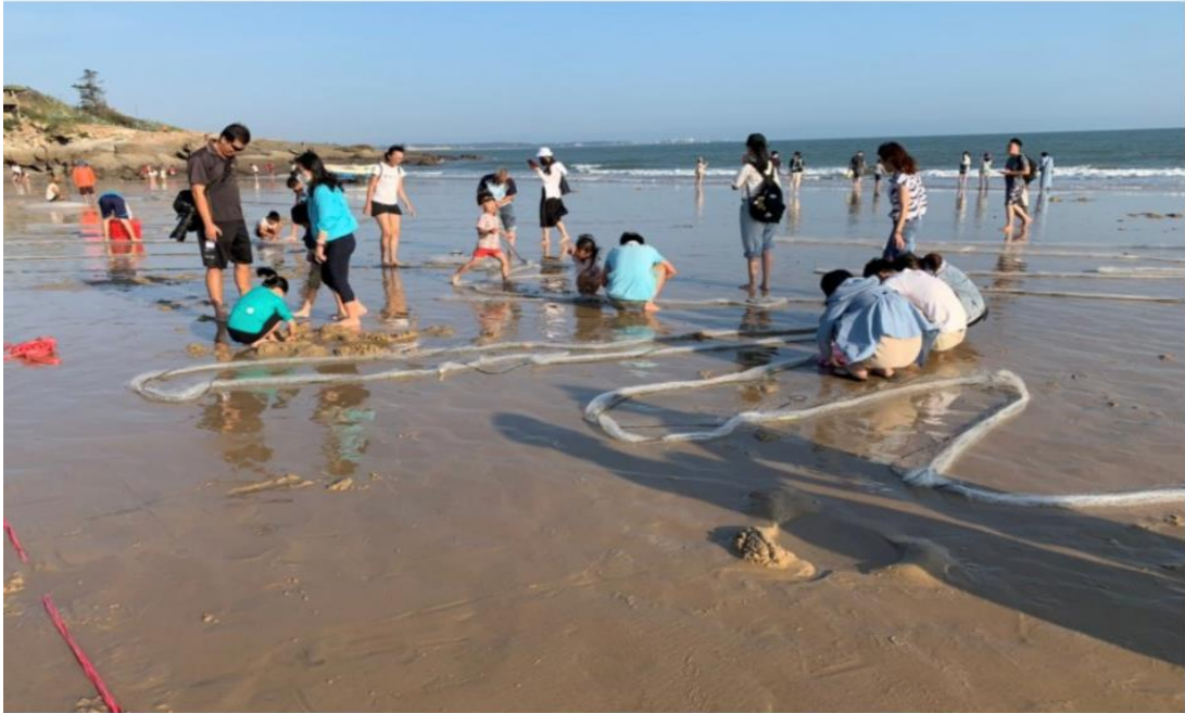
「2023 螢光燦爛-金湖海灘花蛤季」邀民眾一同遊金門踏沙逐浪