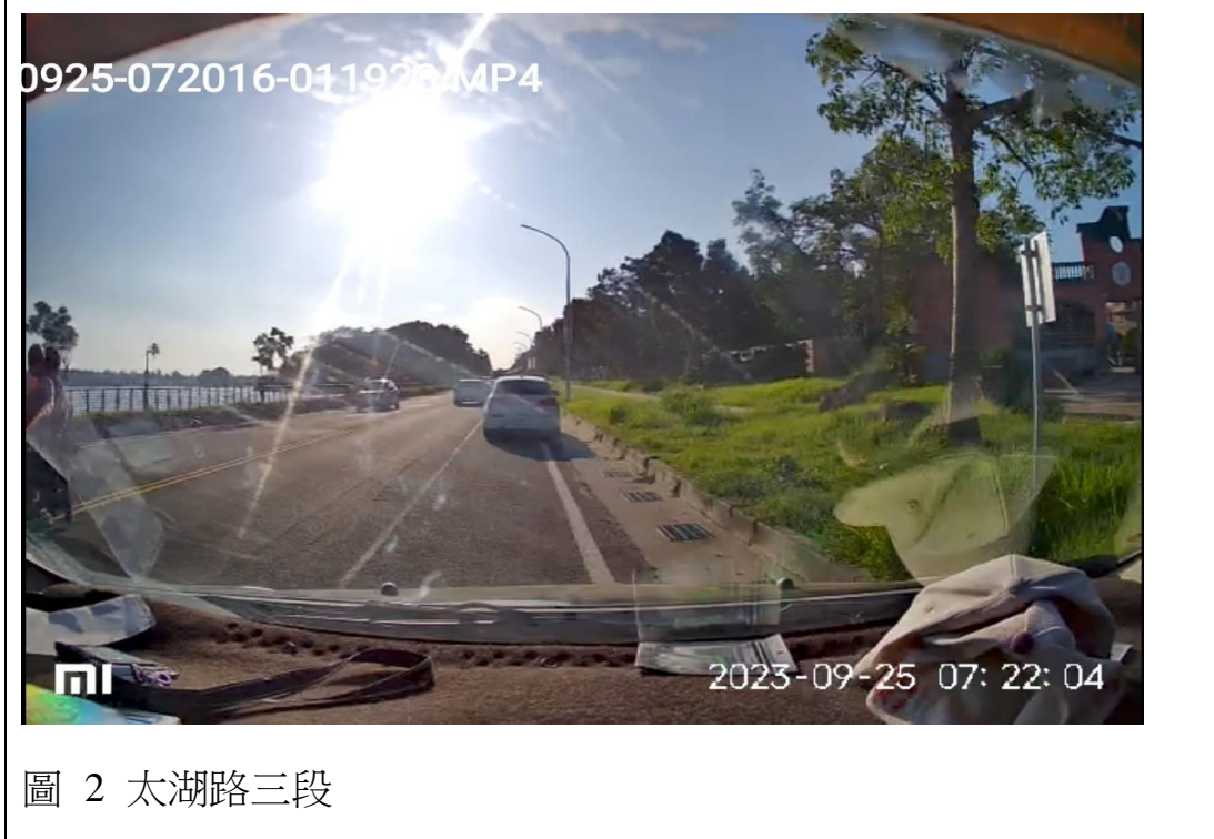
圖 2 太湖路三段