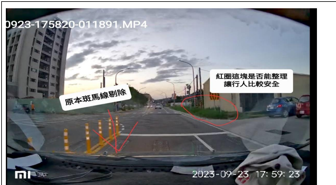
圖 1 太湖路一段