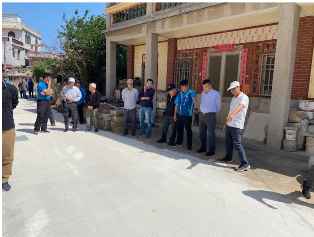
下鄉考察西浦頭鄉村整建工程