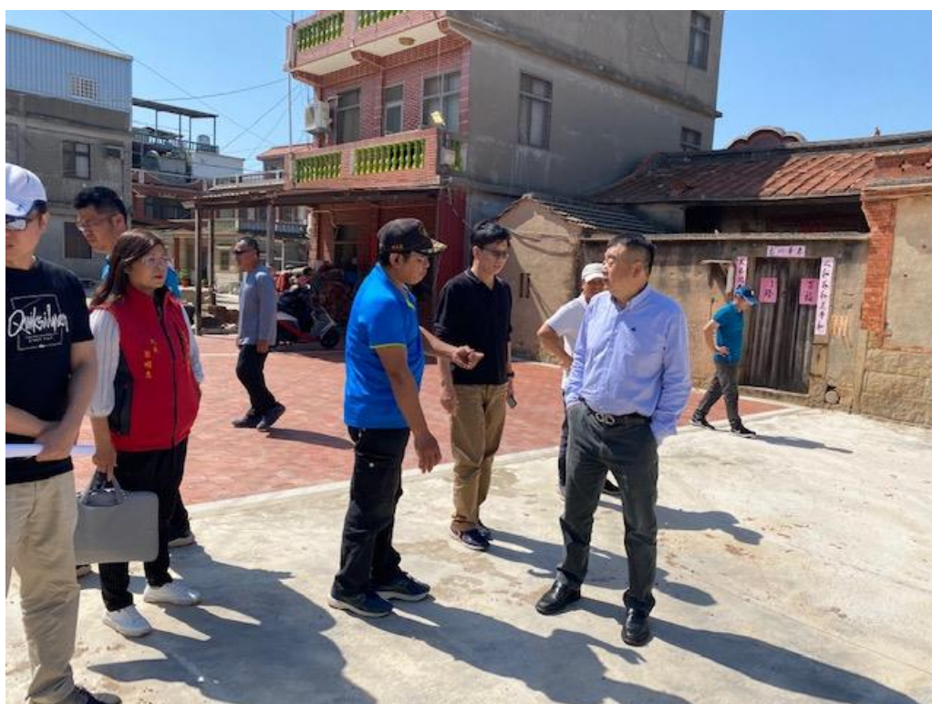
下鄉考察西浦頭鄉村整建工程