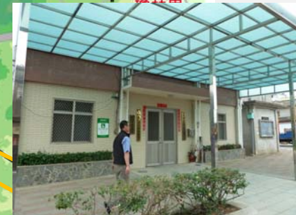
盤山村辦公處 適用災害：水災