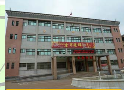
金寧鄉公所 適用災害：水災、震災、海嘯