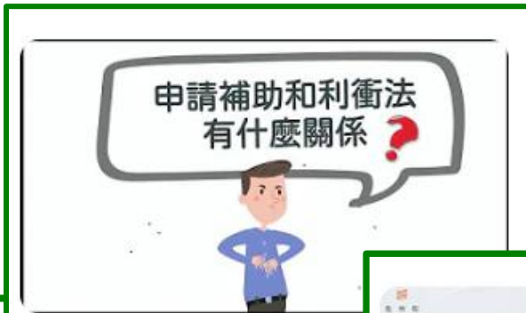
五分鐘，懂利衝 申請補助真輕鬆 觀看次數：2.3萬次 · 1 年前