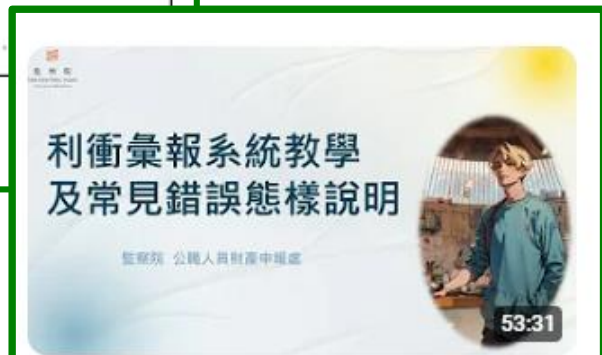
利益衝突迴避彙報系統教學及常見錯誤態樣說明 觀看次數：771次 · 5 個月前