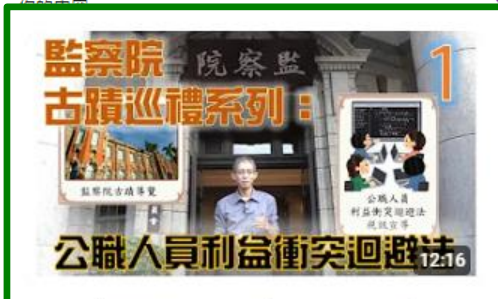
財團法人職場必修課：你「迴避」了嗎！ | 公職人員利益衝突迴避法：1/6 公 觀看次數：1588次 · 1 年前