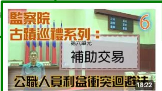
財團法人職場必修課：你「迴避」了嗎！ | 公職人員利益衝突迴避法：6/6 交易補助 觀看次數：902次 · 1 年前