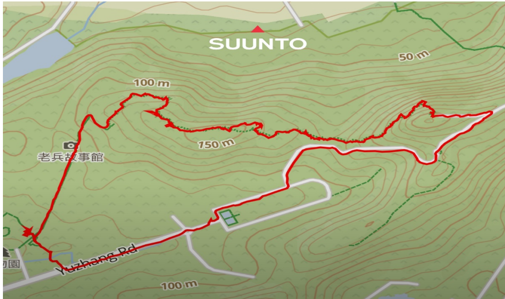
圖 1 金門植物園-千丈壁-路線圖

植物園登山口→莊敬自強→飲水思源→404 碉堡→反空降裝置→千丈壁 (為太武山古 12 奇景之一)→風動石→玉章路→植物園停車場