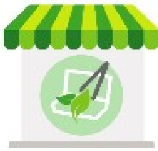
「紙餐具循環友善店家」標誌貼紙