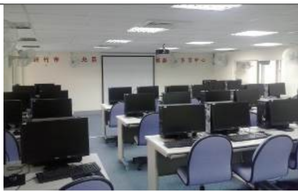
設立樂齡學習中心