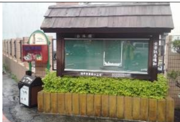
角落意象及設置狗狗黃金屋