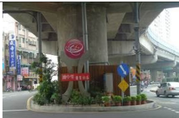
利用高架收集雨水回收