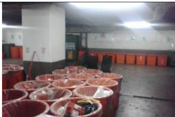
荷蘭村資源回收站