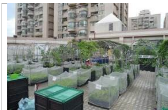
屋頂農園住戶認養一口田