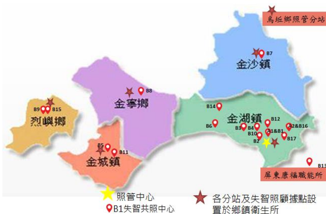
圖 2. 金門縣長照服務資源地圖

截至 108 年 12 月底止，本縣共布建之長照服務資源，包括於衛生局設立長期照顧管理中心，於各鄉鎮衛生所設置長照管理分站，並結合公私立資源，布建 2 家社區整合型服務中心(A)、17 家複合型服務中心(B)，及 8 個巷弄長照站(C)。為照顧失智者，於金門醫院設立失智共同照護中心，並於各鄉鎮衛生所設立失智照護據點。