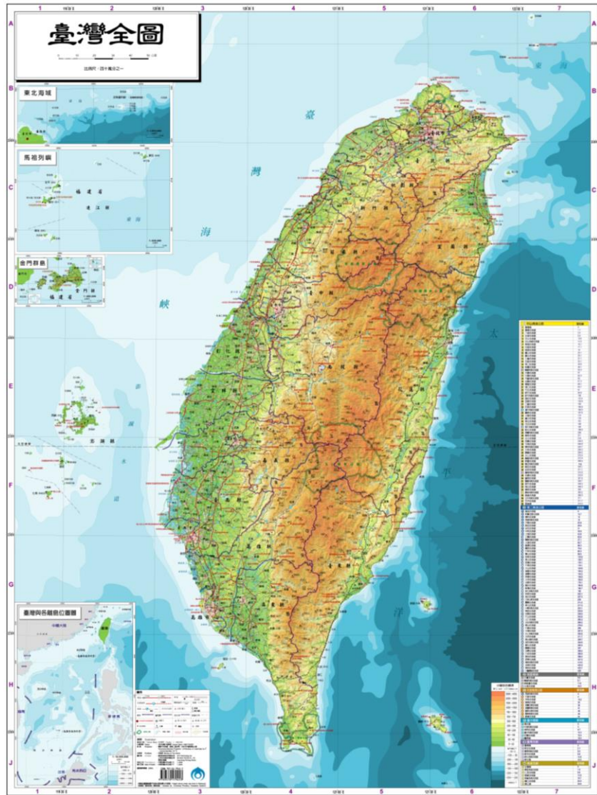
圖 1 臺灣全圖 (資料來源:內政部地政司)