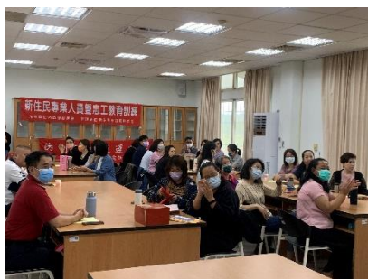
112年5月13日新住民專業人員暨志工教育訓練