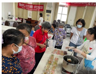
12年8月12日「雕出非凡人生文化饗宴」新住民團體社區服務多元文化交流宣導