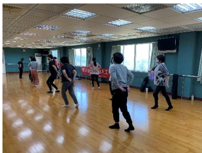
112年4月8、15、22、29日、5月6日，藝文推廣~舞動人生