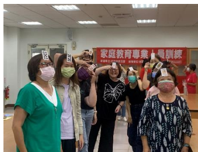
112年6月8日及9月9日新住民家庭服務中心家庭教育專業人員訓練