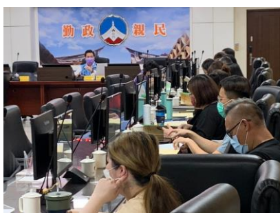
112年6月9日112年度第1次金門縣新住民事務推動委員會暨新住民家庭服務中心聯繫會報