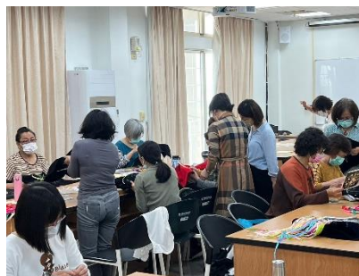
112年4月22日絲帶繡的花樣世界~多元文化在地創生培育活動