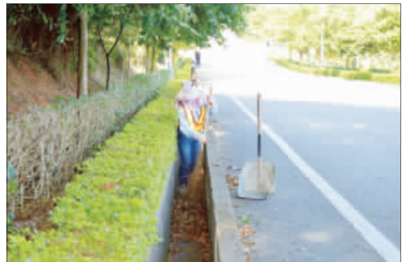
尼伯特颶風將至，清潔隊員針對路旁側溝加強清理作業，以避免豪大雨發生時水溝阻塞造成淹水。

區積水地點及路段加強清理，也呼籲民眾若發現水溝蓋上有雜物堵塞或積水不流時，請順手撿拾清除或通報各鄉鎮公所清潔隊處理，並檢視家附近環境，隨手撿拾、清理可能覆蓋在水溝蓋淺水孔的塑膠袋、輕便雨衣、報紙、樹(葉)等雜物，維持溝渠排水順暢，以免阻礙雨水宣泄造成淹水災情，大家一起來防颱，提早做好防颱準備，將颶風可能災害降到最低。