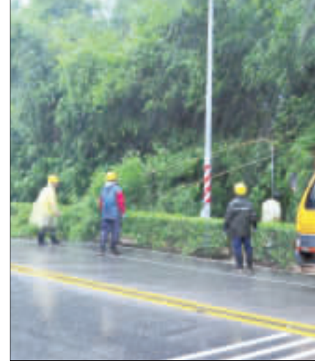
消防局人員清理倒木。

轉為中度颶風的尼伯特將對金門構成威脅，金門縣災害應變中心召開工作會報。 本縣面對尼伯特颶風嚴陣以待，依據中央氣象局警報，颶風於10月9日9時14分解除，縣災害應變中心持續運作至10月9日14時45分解除，回平時之運作機制。目前尼伯特颶風警報解除，但下半部雨勢仍要注意，尤其台灣南部從颶風過後雨量反而更大，所以後續應會持續有豪雨，各單位對水的部分應嚴加防範，各鄉鎮從事災後恢復工作也要注意安全。 消防局表示，在消防局及各單位的持續應變下，縣應變中心受理災情13件，其中樹倒2件、淹水5件、紅綠燈故障及人員孔蓋損壞等警情4件，總計出動各式救災車輛14輛、救災人員35名、機具5組，所有災情均順利處理完成；另林務所共計處理倒木案件18件，目前已完成14件28株倒木清除，包括竹子、木麻黃、白千層、樟樹、樟樹及相思樹等，尚有4件正加緊處理中。 消防局指出，縣應變中心撤除後，仍持續進行轄區災後復原工作，由環保局統籌各鄉鎮災後復原兵力需求，向金防部統一申請後，俟風雨結束後再至各轄區清理環境。 而縣長在颶風期間巡視各級應變中心及轄區，慰勉應變中心執勤人員及救災現場人員辛勞，本次尼伯特颶風在縣長及全體應變人員共同努力下，用最嚴謹謹慎的態度，軍民同心防範，將損失減到最低。