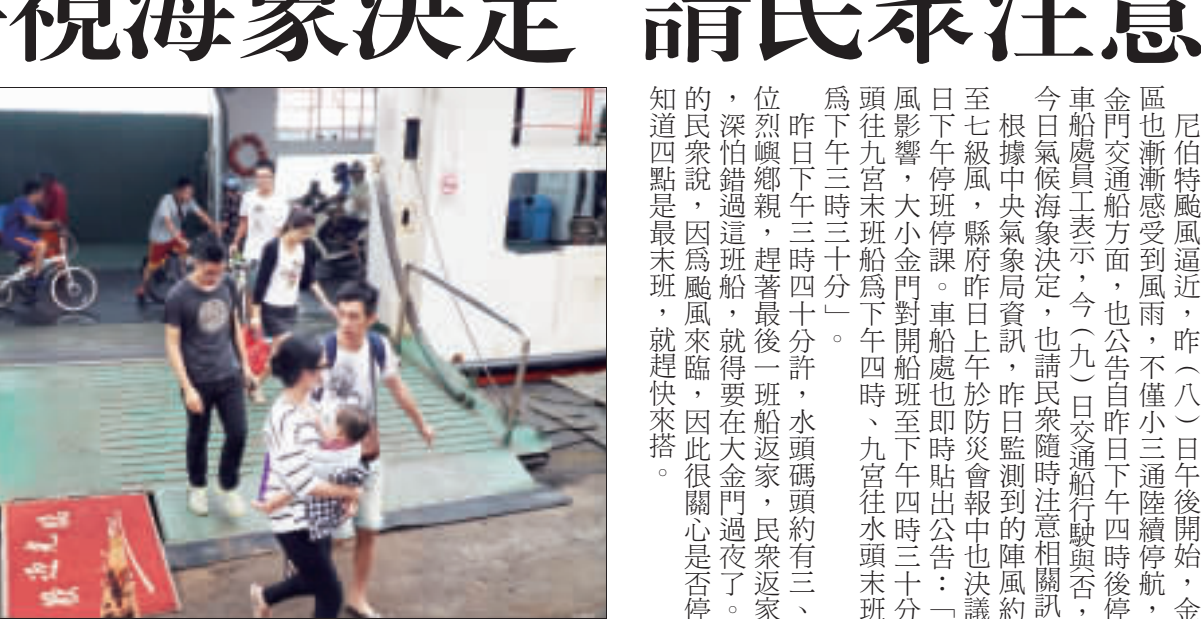
颶風來襲，民眾搭乘末班船返回大金門。

在空運運輸方面，受颶風影響，請民眾搭機前，先行詢問航空站或各航空公司，確認取消與否。