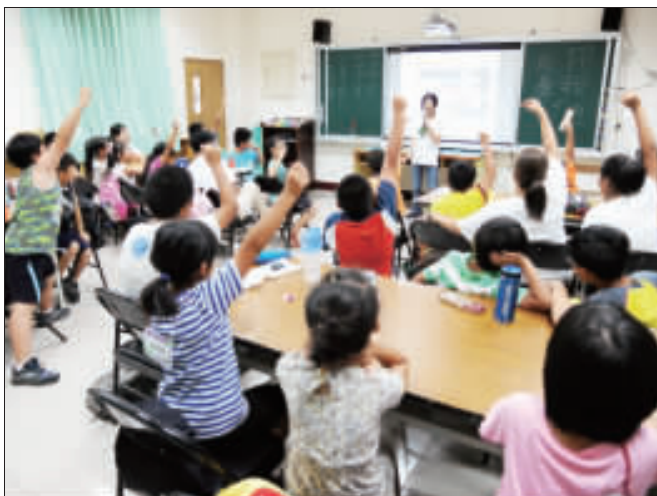
亞東技術學院國樂社、國術社及古箏社的同學們今年度再次抵金門開設「參天巨述」營隊活動，課程精彩熱鬧。

縣長陳福海主持，會中指示所有單位全力投入防救災工作，並由指揮官縣長陳福海主持第一次工作會報。