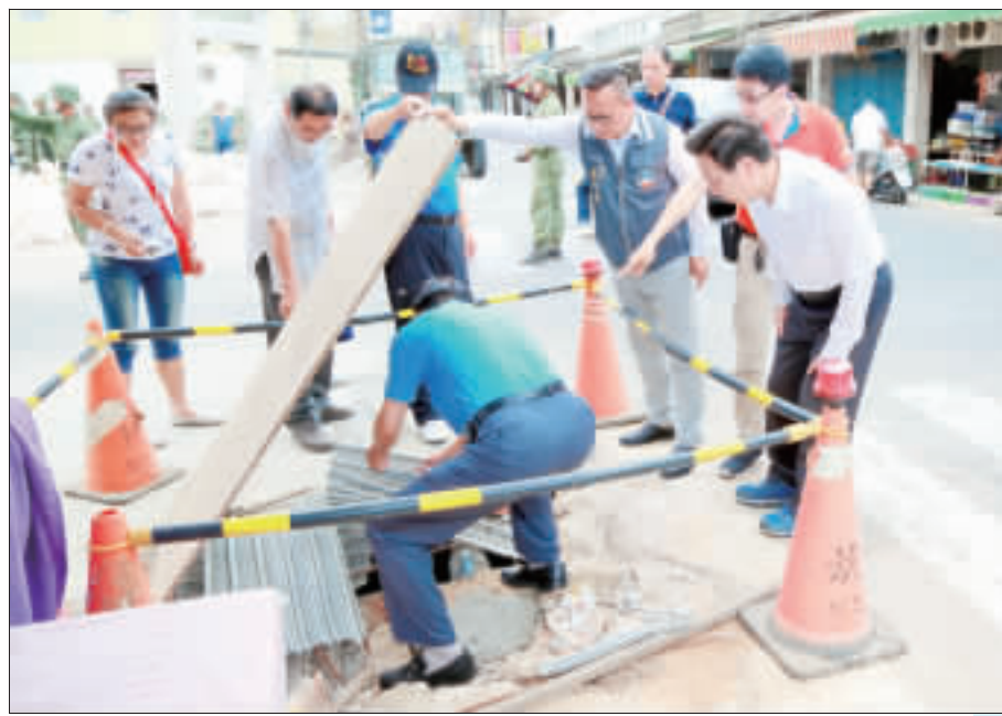
上、金門縣長陳福海巡視城區排水施工和防颱措施；下、中、晚間對金門構成威脅，縣長陳福海到金城地區巡視防抽水準備工作。