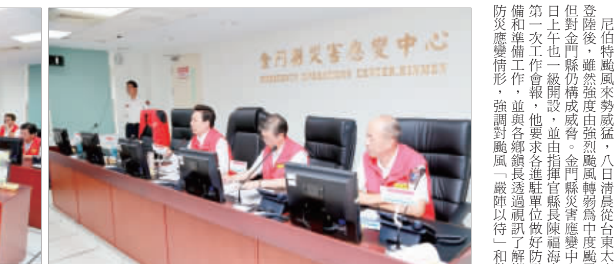
左、右：尼伯特颱風來勢威猛，金門縣災害應變中心昨日上午一級開設，並由指揮官縣長陳福海主持第一次工作會報，他要求各進駐單位做好防飈準備和準備工作。

強村里廣播系統，並視情況整合平台，朝向專人專線處理，以第一時間緊急應變，維護民眾生命財產安全。