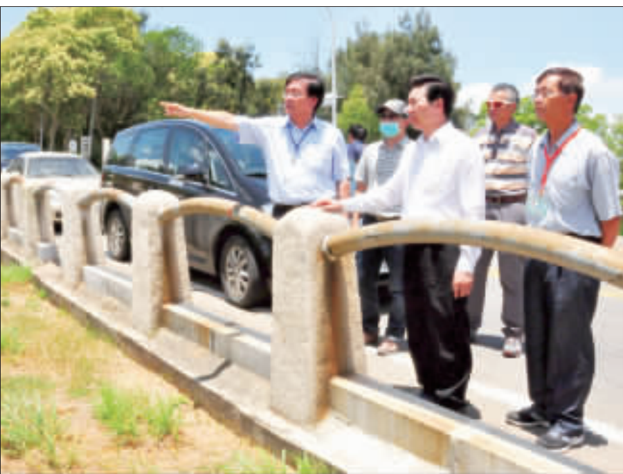
強颱逼近 縣長關切