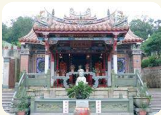
海印寺水車堵：左側（龍邊）「天女獻樂」，右側（虎邊）「天女散花」位置圖。

楊天厚撰，〈金門太武山海印寺裝置藝術試析〉，載《2015金門太武山海印寺暨東南佛教國際學術研討會論文集》，2016