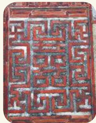
吳厝民宅上的紅磚「囍」字（左），與「卍」字（右）壁堵圖案。