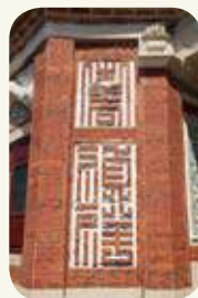
前水頭44號黃輝煌洋樓「壽」字與「禎祥」、「壽」字與「福祿」磚雕。