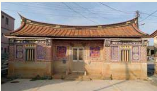
金寧鄉下堡村80號民宅鏡面堵精緻磚雕。左側（龍邊）為「福祿」；右側（虎邊）為「禎祥」。

閩南傳統建築的磚雕，是一種雕飾於紅磚上的工藝，依照雕刻、煨燒先後順序，此種工藝的作法，一般有窯前雕和窯後雕兩種。窯前雕的是在坯土入窯前先行雕刻上紋樣，然後再行燒製成品，但是因為燒製火候關係，成品色澤不易控制，難度頗高，除非是有批量上的需求，否則採行的作者不多。一般單一建築均是採用窯後雕的方式，選用合適顏色、大小、材質的紅磚，直接在紅磚上進行雕刻創作，方便快