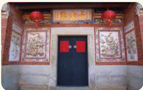
山后民俗村60號「大夫第」(喜慶館)場岫鏡面堵交趾陶精美構圖。