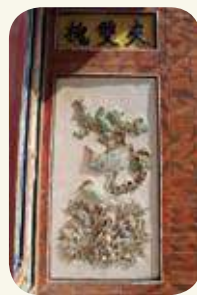
「夾雙槐」題字與「松鶴遐齡」圖。