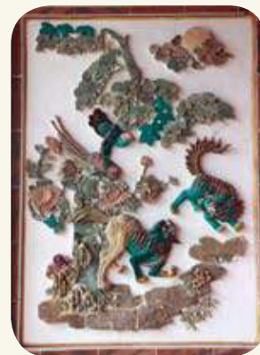
慈德宮塌岫右側（虎邊）對看堵交趾陶作品：錦上添花、太師少師。