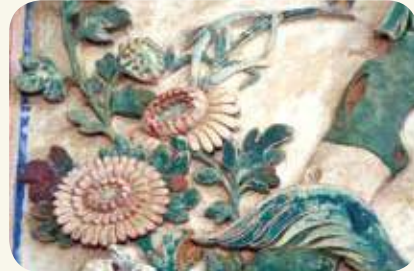
民俗村58號明間右側（虎邊）身堵四君子：菊花（交趾陶）。