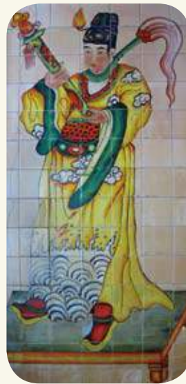
沙美萬安堂左側（龍邊）雙護太監彩繪。