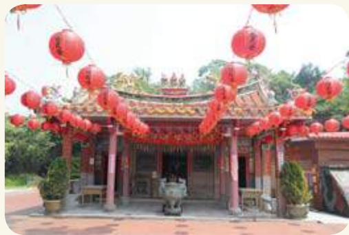
上林李府將軍廟外觀。

自古以來有「五福壽為先」之說法，所謂五福即指壽、富、康寧、攸好德、考終命。福乃為人們孜孜以求的人生大目標。祿神來自祿星。民間傳說中的祿神有二：一為送子神張仙，一為唐代狄仁傑。在早期傳統社會中，祿位甚受民間歡迎。所有「加官進祿」、「官上加官」、「加官進爵」、「馬上封侯」等題材的年畫、風俗畫、吉祥圖案等十分流行，備受歡迎。這類畫常使用諧音借代方法，如以「鹿」寓「祿」，以桃寓「壽」，以蝙蝠寓「福」。