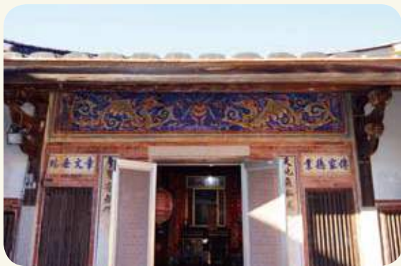
碧山陳氏一落四櫺頭鏡面堵「雙龍戲珠」彩繪，構圖精美。

陳氏祖籍河南光州固始，支分泉州晉江深滬，再徙碧山村，為單姓傳統血緣聚落，村內擁有許多中西合璧形式的閩南合院與洋樓，內外裝飾特徵豐富而多元。碧山陳氏一落四櫺頭建於民國三十年代，陳氏族人自新加坡發跡後返鄉興建，位處陳氏大宗祠前方緩坡上，周邊大部分都是同樣形制的合院，外牆石确則多取材自鄰近的海濱，或花崗岩石山。合院深井內，仰頭即見鏡面牆上端一對雙龍戲珠，圖樣和色