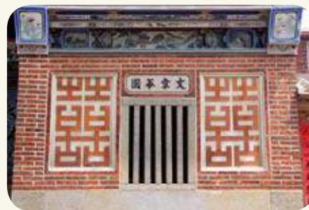
金城鎮後浦北門將軍第鏡面「囍」字磚雕。