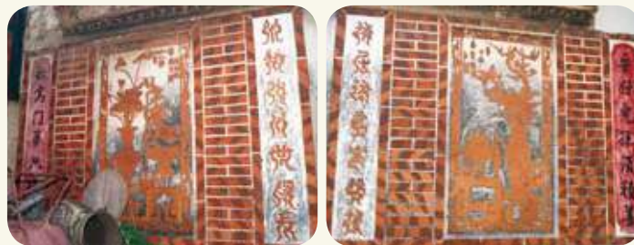
浦邊周氏古宅精湛的「花杆博古圖」磚雕，與兩側龜勉子孫的對聯。

手柑、桃、石榴三種，以及香爐、花台、花瓶等組成的博古圖。蓮自古是聖潔高雅，如君子和潔淨的比喻，幡供養佛菩薩的莊嚴之具，有象徵威德之意，蓮和幡則有「連番」的諧音，菓子則比喻著多福、多壽、多子孫。整體表現出人們祈求家族繁榮昌盛、子孫賢德的想望。