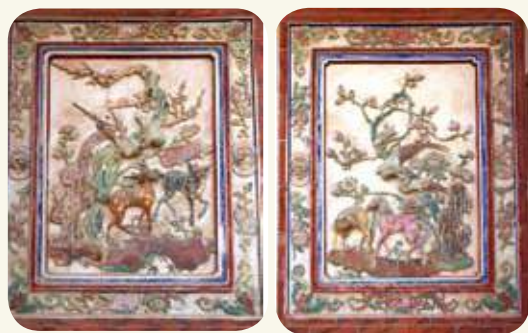
堵仁「鹿鳴菊苑湛賓主，鶯唱梅梢昭德音」。(左)