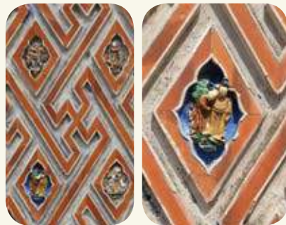
山后民俗村73號宅兩側次間鏡面堵磚組砌卍字磚雕、陶捏人偶。