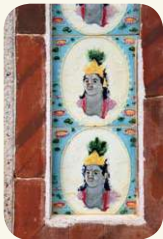
頂堡翁德晏三蓋廊厝正面塌岫日本花磚「象身甘尼許」裝飾。

引入東南亞等地後，作為逐漸取代傳統民居於彩繪、雕刻與泥塑的裝飾位置，出現在金門傳統建築牆身的水車堵、棋仔頭、窗楣堵等部位。在頂堡翁德晏三蓋廊屋裡，其中正面塌岫除了「松鶴延年」四片一組和寓意多子多孫的花朵