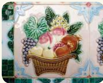
東沙民宅壽（桃）、富（梨、利）、康寧（枇杷）、攸好德（葡萄果實成簇聚集在一起合群好德性）、考終命（石榴：好命多子多孫多福氣）等五福，寓意「五福臨門」。