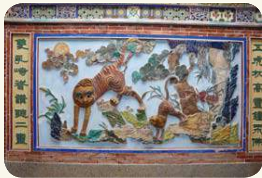
慈德宮龍虎堵： 母虎戲子。