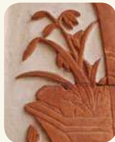
民俗村61號明間左側（龍邊）對看牆身堵四君子：蘭花（磚雕）。