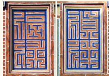
金寧鄉下堡村80號民宅「禎祥」、「福祿」磚雕。