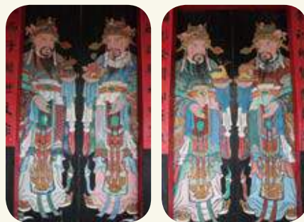
瓊林蔡氏家廟三川門次間「加官晉祿」、「富貴晉爵」文臣門神彩繪。

楊天厚、林麗寬，參考邵慶旺主持《金門縣國定古蹟瓊林蔡氏祠堂彩繪調查研究與維護計畫成果報告書》，2014