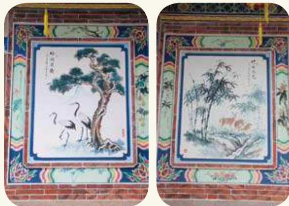
東沙村33號民宅左側（龍邊）鏡面堵「松鶴遐齡」、右側（虎邊）鏡面堵「竹林鹿苑」彩繪。