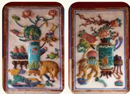
庵前牧馬侯祠塌岫交趾陶：左側（虎邊）為「象負果盤」；右側為「獅馱鼎爐」