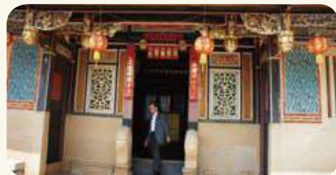
湖下村楊華總兵署鏡面堵「卍」字磚砌。