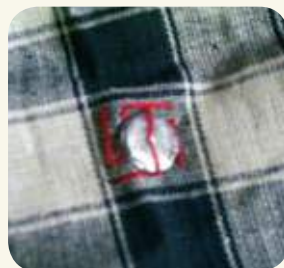
以「鉛錢」和紅絲線縫製的「花帔」是民俗中的育嬰聖品。