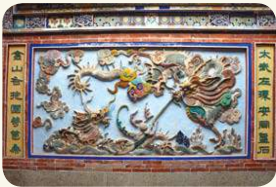
慈德宮龍虎堵： 雙龍戲珠。

慈德宮具有歷史與文化保存價值，除在建築形制之外，其交趾陶、剪黏與石雕藝術，作品精緻細膩，雕工更有其價值性與可看性。牆堵手繪的歷史故事，更具教化人心潛移默化的功能。其中龍虎堵係指位於步口廊左右兩側的對看堵，位在慈德宮左側（龍邊）的龍堵，其龍頭朝內。右側（虎邊）的虎堵，虎頭朝外。以交趾陶燒製的龍虎堵，做工之精細，更是許多廟宇參考的對象。