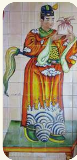
沙美萬安堂右側（虎邊）雙護太監彩繪。