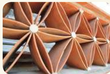
傳統匠師發揮巧思，以板瓦搭建令人眼睛為之一亮的「瓦花組砌」。