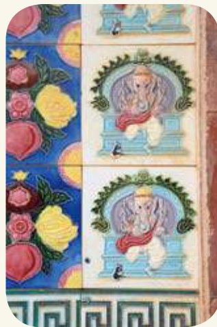
頂堡翁德晏三蓋廊厝正面塌岫日本花磚「黑天」裝飾。