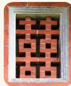
金湖鎮東村民宅窗戶「囍」字磚組砌。