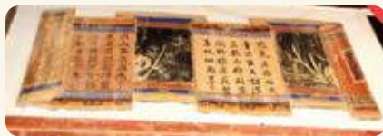
西山前李氏宅第右側（虎邊）書卷裝飾。