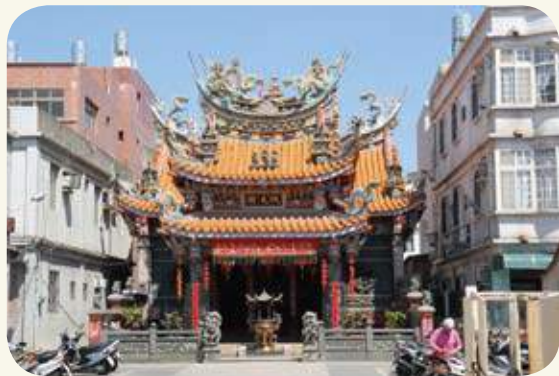
後浦東門里代天府廟三川殿屋脊「雙龍戲珠」剪黏作品。