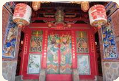
官澳村龍鳳宮門神彩繪，出自烈嶼藝師林天助手筆，用色鮮豔，神韻捕捉得宜，亦為不可多得彩繪珍品。