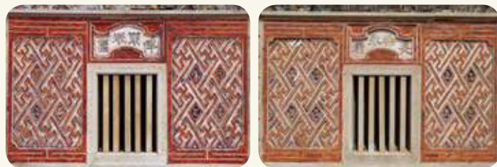
民俗村73號宅次間鏡面卍字磚組砌：左側（龍邊）石窗有「長樂永康」；右側（虎邊）有「俾爾熾昌」泥塑祝賀語。