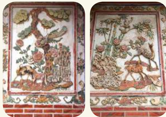
山后民俗村73號塌岫鏡面堵交趾陶圖案。