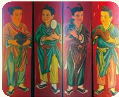
浦邊村蓮法宮「合境平安」門神彩繪。