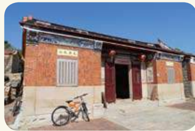
山后民俗村75號宅明間對看堵，左側（龍邊）「夾雙槐」題字與「松鶴遐齡」圖；右側（虎邊）「交五柳」題字與「逐鹿高昇」圖。

「五柳先生」是陶潛別號。陶潛曾作〈五柳先生傳〉以自況，文中提到：「宅邊有五柳樹，因以為號焉。」宋楊萬里〈張功父請祠甚力得之簡以長句〉詩：「老夫老矣不歸去，五柳先生應笑汝。」後世亦簡稱「五柳」，泛指志趣高尚的隱士。唐雍陶〈和孫明府懷舊山〉詩：「五柳先生本在此，偶然為客落人間。」人到無求品自高，屋主以結交如同陶潛般隱逸之士自許，再搭配題字下端的「逐祿高昇」交趾陶圖案，採用不使人俗的竹子，與雙鹿為主構圖。中空有節的竹子，象徵彬彬君子奮發有為；「鹿」與「祿」諧音。藉由簡易構圖，彰顯自己高尚情懷，更勉勵後進當奮發向上，做個有為有守的傑出人才。