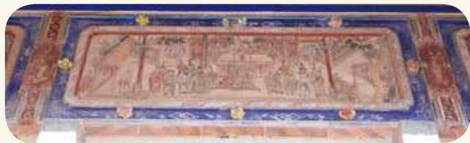
山后民俗村66號宅門楣上方「汾陽王府」彩繪。