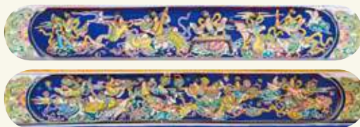
海印寺左側（龍邊）水車堵「天女獻樂」、右側（虎邊）水車堵「天女散花」交趾陶。