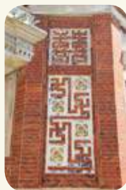
前水頭44號黃輝煌洋樓「囍」字與「卍」字不斷磚雕組砌。