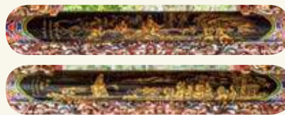
太武山海印寺拜殿兩側（龍邊）為「觀音送子」圖，右側（虎邊）為「觀音顯靈」圖。