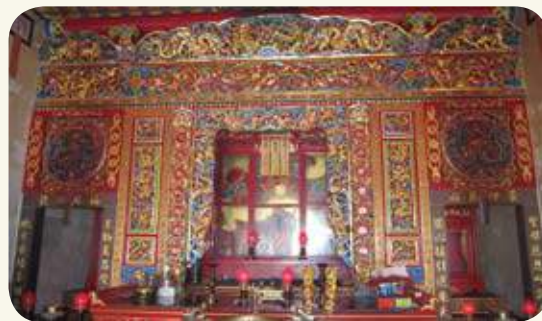
東沙尾蓮山宮左右次殿神龕「福祿」。

洪春柳參考清·段玉裁《說文解字注》，1974 江柏煒《大地上的居所》，1998。蔡鳳雛《金門地名調查與研究》，2011