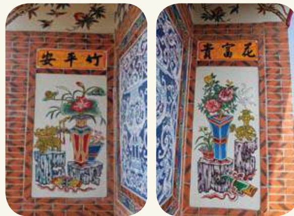
後浦頭4號宅塌岫右側（虎邊）對看堵「竹平安」、左側（龍邊）對看堵「花富貴」吉祥物彩繪。