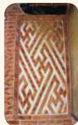
北山振威第塌岫對看堵「卍」字磚砌。