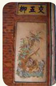
「交五柳」題字與「逐鹿高昇」圖。