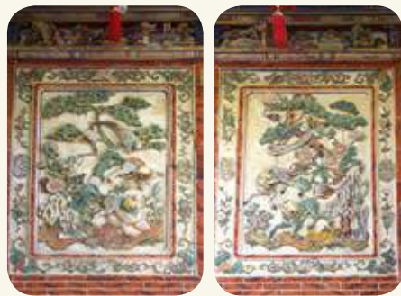
堵仁「鶴鴦桐菊手足篤，祥獅相顧貞如意」。(左)