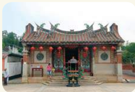
豐蓮山庵前村牧馬侯祠「獅馱鼎爐」與「象負果盤」位置圖。