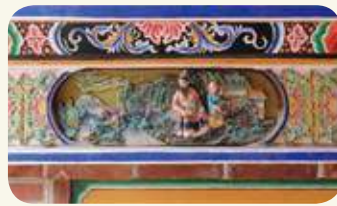
海印寺左側（龍邊）君子四愛——周敦頤愛蓮、林和靖愛梅。