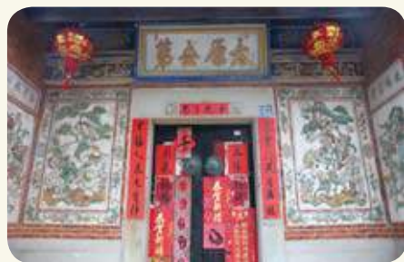
山后民俗村58號「太原世第」王氏宅第，塌岫鏡面堵交趾陶精緻圖案。