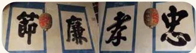
瓊林蔡氏家廟「忠孝廉節」墨寶。

忠、孝、廉、節，《說文解字注》分別解釋為：「忠，敬也。盡心曰忠。敬者，肅也，未有盡心而不敬者。」；