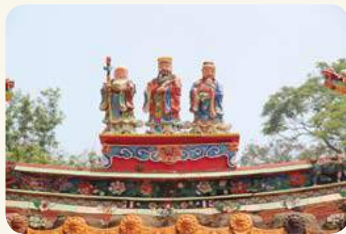
上林李府將軍廟屋脊福祿壽三星交趾陶。