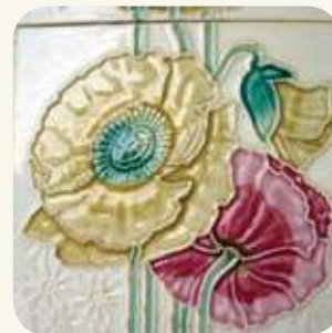
烈嶼鄉上林村洋樓磁磚的罌粟花圖案。