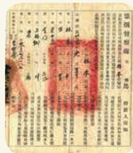
民國25年由禁烟督察處頒發的「限期戒烟執照」，為烟害防治寫下歷史見證。