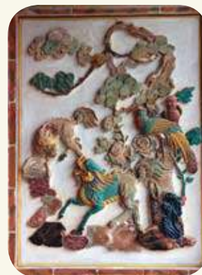
慈德宮塌岫左側（龍邊）對看堵交趾陶作品：三王獻瑞。