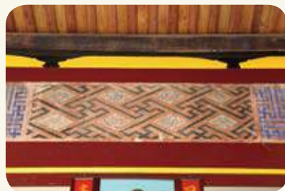
青岐村21號宅客廳屏門頂堵的「卍」字花紋，與四藝、四季花彩繪，祈求四季平安幸福。