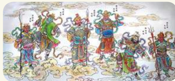
沙美萬安堂「十二藥叉大將」彩繪之二。