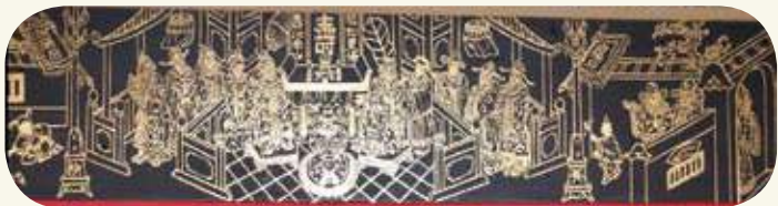
山后民俗村62號「海珠堂」廳堂橫額坊「汾陽王府」描金繪圖，俗稱「郭子儀拜壽」。

郭子儀（697-781），唐代名將。華州鄭縣人。唐玄宗時，為「朔方」節度使；肅宗時，因弭平「安史之亂」有功，遷為中書令，敕封「汾陽郡王」；代宗即位，子儀再因抵禦「回紇」、「吐蕃」入侵，榮升太尉中書令。治軍謹嚴，賞罰分明，故能深得人心，一身繫唐朝安危達二十年之久。德宗即位，尊為「尚父」，罷兵權。享壽85，死後賜諡「忠武」，配饗代宗廟庭。世稱「郭汾陽」或「郭令公」，此即兩幅構圖皆在旗竿上高懸「汾陽王府」理由。子儀有子