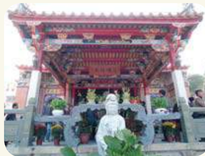
太武山海印寺拜殿兩側通樑播金彩繪：左側（龍邊）為「觀音送子」圖；右側（虎邊）為「觀音顯靈」圖。

楊天厚，〈金門太武山海印寺裝置藝術試析〉，載《2015金門太武山海印寺暨東南佛教國際學術研討會論文集》，2016