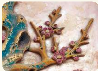
山后民俗村60號明間右側（虎邊）身堵四君子：梅花（交趾陶）。

以「隱逸」見稱的菊花《花經》列「四品六命」。《圃史》：「時至暮秋，群芳搖落，而菊獨殿秋光，抱寒馥以競晚節，所以識之者儕之芝蘭，比之君子。」《三餘贅筆》「曾端伯以菊花為佳友，張敏叔以菊為壽客。」陶潛〈飲酒〉：「採菊東籬下，悠然見南山。」「菊」與「吉」諧音，故能在民俗村吉祥圖案獨佔鰲頭。 楊天厚，取材自《餅花譜》、《花經》，1995