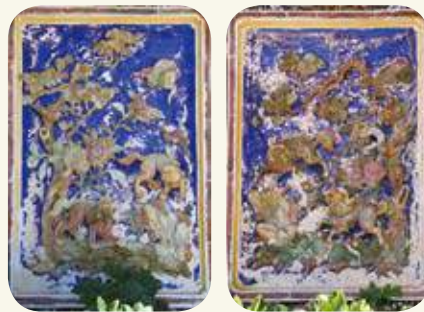
湖前57號交趾陶：左圖為虎邊的「英雄奪錦」；右圖為龍邊的「三王圖」。