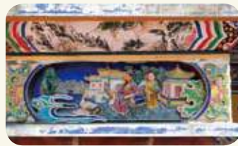
海印寺左側（龍邊）君子四愛——王羲之愛鵝、陶淵明愛菊。