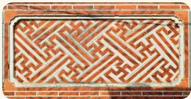
后沙許丕簡古厝向埕牆，寓意吉祥如意的「萬」字磚組砌。

萬字紋常見用於服飾、陶瓷、木雕、磚雕、石雕、窗櫺，作為藝術形式的紋樣或裝飾花邊，在金門，則可常見於傳統建築的彩繪、磚組砌、窗櫺等裝飾中。其中，「卍」字即稱「萬」字，寓意吉祥之意，常以「萬字不到頭」、「萬字