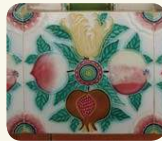
東沙民宅多福（佛手柑）、多壽（桃）、多男子（石榴），與寓意平安（蘋果），建構成「四季平安」吉祥圖案。