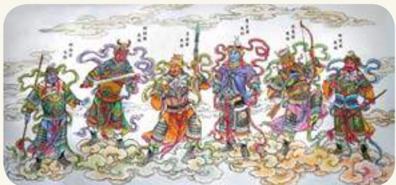
沙美萬安堂「十二藥叉大將」彩繪之一。