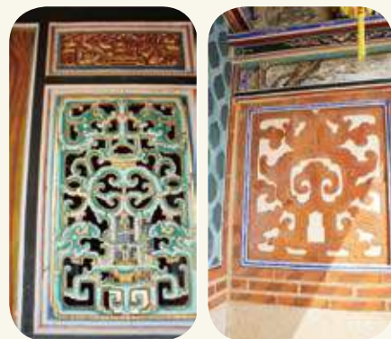
湖下村楊華總兵署塌岫對看堵的「螭虎圍爐」木雕、磚雕。