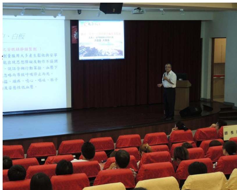
103年9月15日金門大學開學典禮演講