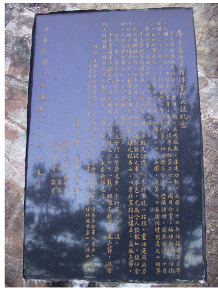
圖 6-2-2-1 李良榮將軍紀念碑

生於民國前四年（公元 1908 年）十二月二十五日，福建省同安縣集美鄉人，六歲啟蒙於英隸「清華小學」，十二歲進入廈門鼓浪嶼「養元中學」，受新潮流之薰陶，深惡帝國主義對我國之侵凌，和軍閥愚妄禍國，毅然投身革命。於十三年十七歲，考取黃埔軍校，接受革命教育和軍事訓練，歷經北伐、抗日戰爭，著有功勳。民國三十八年國共「古寧戰役」，任二十二兵團司令，積極佈署防務，加緊戰備，贏得戰役勝利，居功甚偉。其後調台，四十一年退役，四十六年三月被徵召參選台灣省臨時參議員，高票當選，七月奉派前往東南亞宣慰僑胞，其後並在馬來西亞開設水泥廠，大展鴻圖，不幸於五十六年（公元 1967 年）六月二