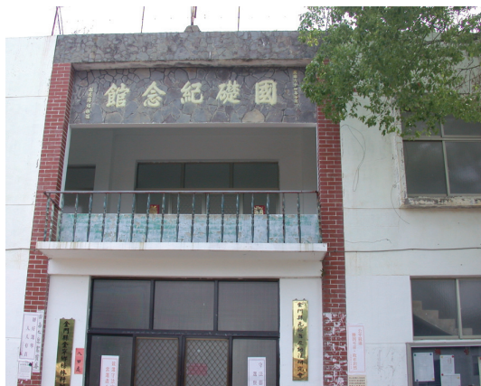
圖 6-2-1-1 榜林「國礎紀念館」

職，時逢國家動盪不安之際，乃游走各方，推動僑民團結愛國並組織不少僑民組織，籌賑、勞軍不遺餘力。期間，夫人遭日軍殺害，兒女分寄各處，國礎仍義無反顧投入救國行動，其精神令人欽佩，於民國五十八年逝世。國礎忠貞毅勇，一生熱愛國家民族，致力僑務，推動教育文化，公而忘私，允稱海外英傑之士。鄉人感念其一生英偉，奉獻鄉邦，特將故里學校，命名「國礎小學」，校舍中央主樓命名為「國礎紀念館」（圖 6-2-1-1）。