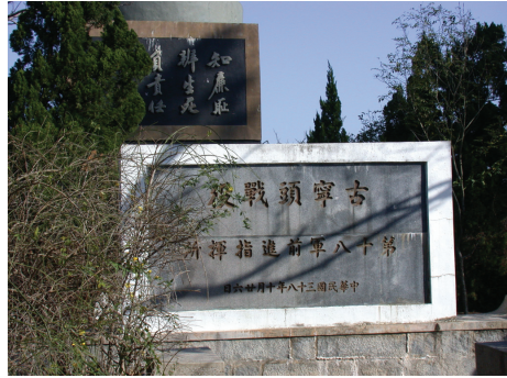
圖 6-2-2-2 高魁元古寧頭戰役指揮所

將軍為一位勇毅果敢軍人，睿智沉靜。處事果決明快，馭繁於簡。用人惟才，公私分明，是位智慧型之良將。現本鄉湖南高地仍保留先生當年戰役指揮所（圖 6-2-2-2）。