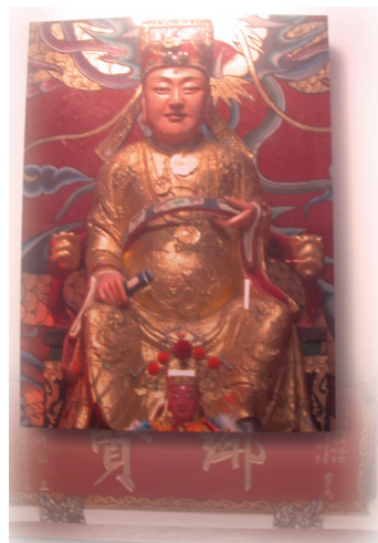
圖 6-1-1-1 許獬雕像

萬曆二十五年（丁酉，公元一五九七年）舉於鄉，翌年下第歸。參政汪道亨延之署中夕談文外，不涉一私。庚子（萬曆二十八年，公元1600年）上春官，與太倉王衡（字辰玉）會文蕭寺，王世代翰林，父曾為宰相，素性高傲，獨心折獬。翌年（辛丑，萬曆二十九年，公元1602年）會試，王衡場後見獬卷，大驚曰：「第一人屬子矣」，放榜，果然獬居首，衡次之。殿試獬得二甲一名，改庶吉士，尋授編修，館課一出，人爭抄傳。嘗自勵云：「取天下第一等名位，不若幹天下第一等事業，更不若做天下第一等人品。」大學士李廷機（字爾張，晉江人）素端介，獨與許獬友善，談必竟日。