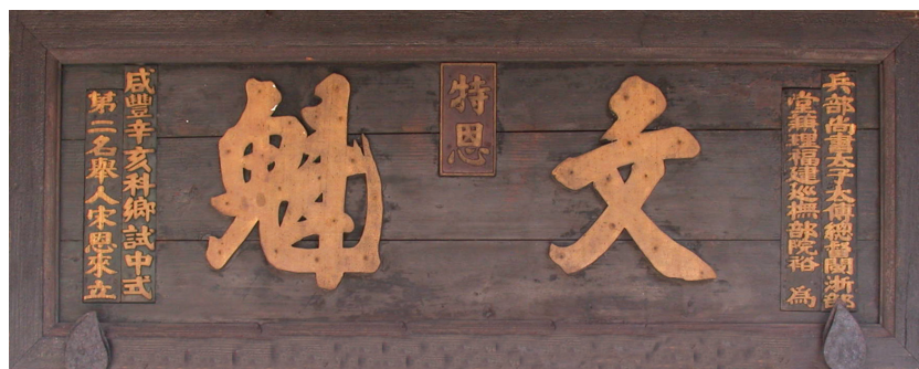
圖 6-1-2-5 宋恩來文魁匾