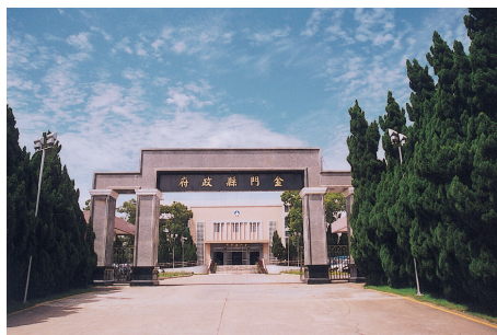
圖 3-2-2-1 金門縣政府