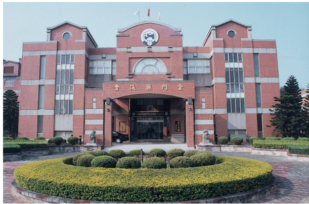
圖 3-2-3-1 金門縣議會

本縣為博採民意，於四十六年五月，依據「金馬地區實驗戰地政務施政綱要」規定，設置縣政諮詢會議，由縣政府就各鄉鎮人口之多寡，分配名額遴聘諮詢代表，任期久暫不定，主席由縣長兼任，其職權及諮詢建議事項如次：