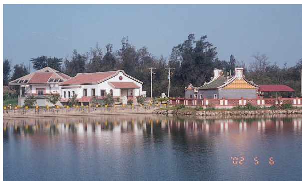
圖 2-6-1-4 自然環境優美是安養好地方

未來老人養護問題必然逐漸顯現，建議金門縣除了依循中央政府的政策以外，亦需開始建立自有的老人福利設施。金寧鄉得以利用舊有公有房舍規劃老人福利中心及安養中心，或者以新的「居家照顧」觀念，以照顧日益增多的老年人，並且增加就業機會（圖 2-6-1-4）。