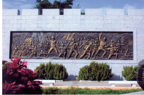
圖 2-6-2-5 戰役浮雕

古寧頭戰役，是現代中國最關鍵的一場戰役，遏阻共軍氣燄，力挽國軍頹勢，奠定海峽兩岸長期分治局勢，直比中國史上「赤壁之戰」和「淝水之戰」，決定三國分立和南北朝對峙，影響現代中國至深且鉅。活化古寧頭戰役史蹟，闡釋國共海島作戰的攻防戰術，除瞭解戰役真相外，亦具軍事教育意義，更誘