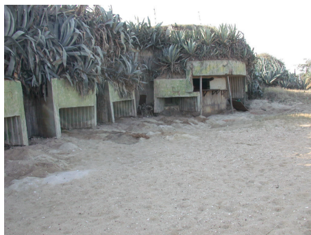
圖 2-6-1-2 海岸遺留眾多軍事碉堡

(5) 斷崖處：斷崖處為共軍被包圍之處，地景特殊並負有特殊歷史性，必然可以開發成為主要風景點（圖 2-6-1-2）。