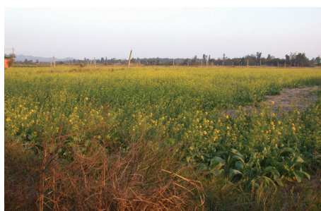
圖 2-6-1-3 農業正朝有機農作發展