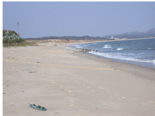
圖 2-6-1-1 海岸沙灘白淨海水蔚藍

有鑑於戰地政務終止以來，發展觀光事業，已列入本縣首要事項（圖2-6-1-1），惟目前存在一些課題：開放大陸觀光客來金的因應課題；軍事區管制開放課題；以觀光產業帶動其他產業課題；遊憩據點吸引力不足課題；解決對外交通瓶頸、提升島內運輸系統服務品質課題；提升旅遊業者共識與專業素養課題；觀光行銷與推廣課題；建構旅遊親善環境課題；法律規定的突破，打通民間投資觀光產業之瓶頸課題；觀光資源與觀光相關行政部門之整合課題。