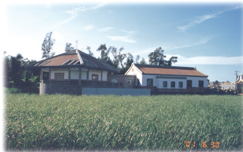
圖 2-6-2-1 慈湖生態

1. 慈湖地區(圖2-6-2-1)：主要生態景觀包括樹林、湖泊、濕地以及依附地區生態的鳥類與湖泊動植物。地區森林以木麻黃為主，伴生植物包括馬櫻丹、潺稿樹、蘆葦等。金門的鳥類因保護而能長存，金門鳥類出現在慈湖者，不論數量與種類者屬最多。