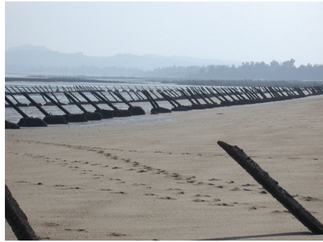
圖 2-6-2-2 海灘防禦工事

古寧頭戰役，關鍵台海兩岸政局，距今歷史不遠，有血有淚，本鄉有一半以上淪為戰區，處處有戰爭遺蹟，為闡述戰史最佳的教材，如能利用本鄉戰役的史蹟，規劃成戰爭的體驗區，令人有身歷戰場的感覺，將可使人文觀光更上層樓。