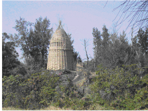
圖 2-6-2-3 碉堡藝術化特色

與人文的風貌特色，例如：盤山村，有紅磚洋樓和地下坑道，媲美瓊林坑道；后湖村，白色沙灘和老雞蛋花樹；安岐村，有最高的風獅爺，以及周圍的大片廢棄基地；榜林村，有愛國志士陳國礎紀念小學；后盤村，有廢棄小學和繩痕深水井。總之，本鄉各村都有其地方風貌特色，可做為鄉土發展的方向。