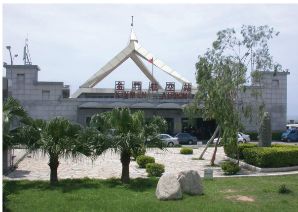
圖 2-6-2-4 金門航空站

航空是現代交通成長最快，也是國際旅遊最重要的交通工具，金門機場有三分之二在本鄉，機場聯外道路亦在鄉域，使本鄉成為金門空中交通的門戶。鑑於航空交通，是未來商務旅遊最主要的交通工具，也是一個地方邁向國際城市不可或缺的基礎建設，本鄉位置優越，