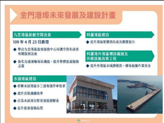
109 年金門港埠建設計畫