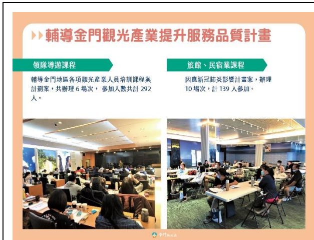
109 年 3 月至 6 月輔導金門觀光產業人員培訓課程