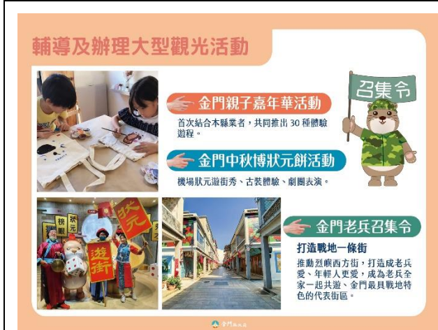
109 年辦理親子嘉年華(7/1-8/31)、博餅(9/1-9/30)、老兵召集令(9/30-12/15)活動吸引遊客