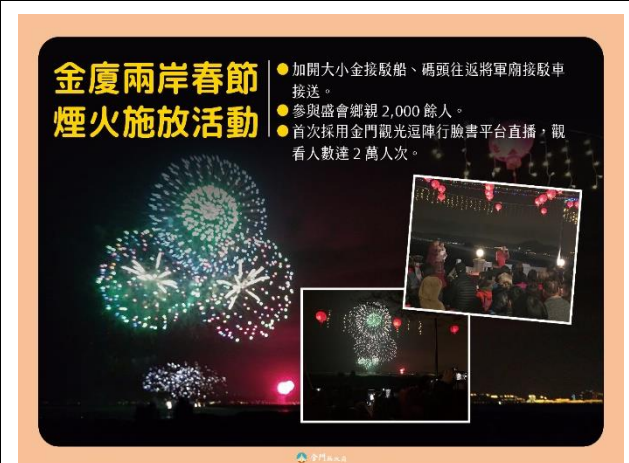
109 年 1 月 25 日 2020 年金廈兩岸春節煙火施放活動