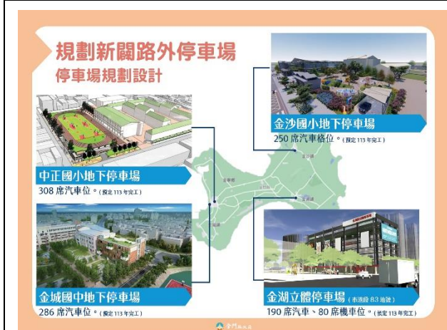
109 年規劃新闢路外停車場