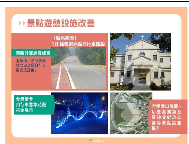
109 年辦理景點遊憩設施改善