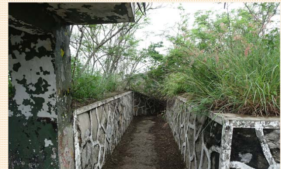
基地內聯絡壕溝完整