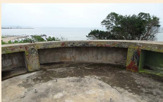
防空炮固定座及彈藥儲備坑