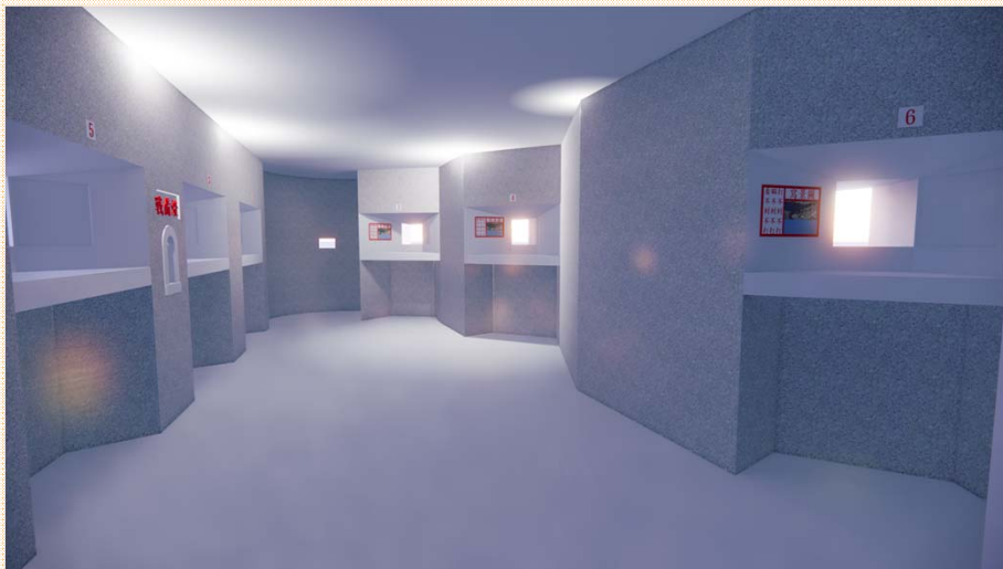
射口空間復舊模擬