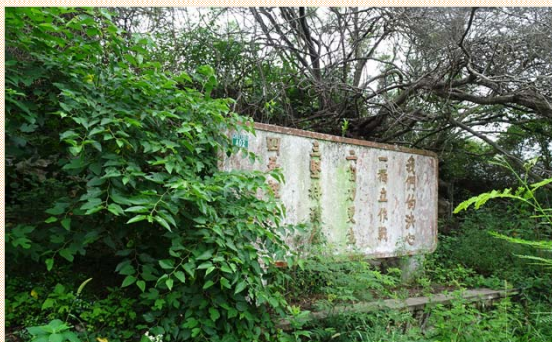
廣場精神標語牆保存完整