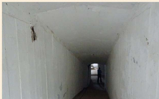
碉堡連結坑道保存完整