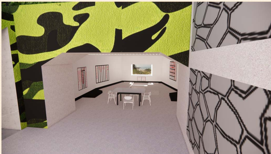
火炮射口休憩觀景空間模擬