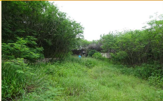
營區集合廣場雜草叢生