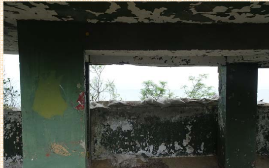
衛兵觀測哨及其良好之視野