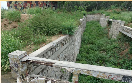
既有過路橋板損壞