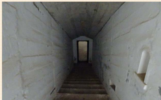
碉堡連結坑道保存完整