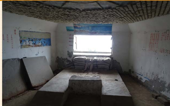
M1式五七戰防砲基座射口