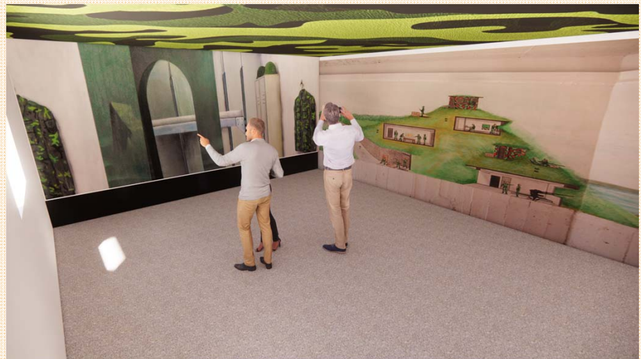
營舍展示空間模擬