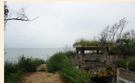
衛兵觀測哨及其良好之視野