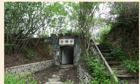
坑道入口及連絡道保存完整