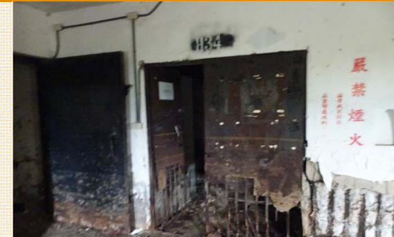
槍械室管制門及標語