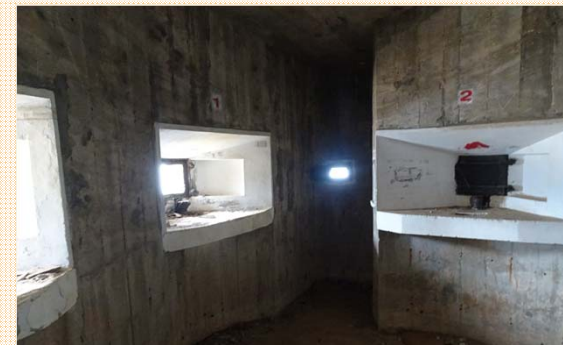
碉堡內射孔及防護閘門