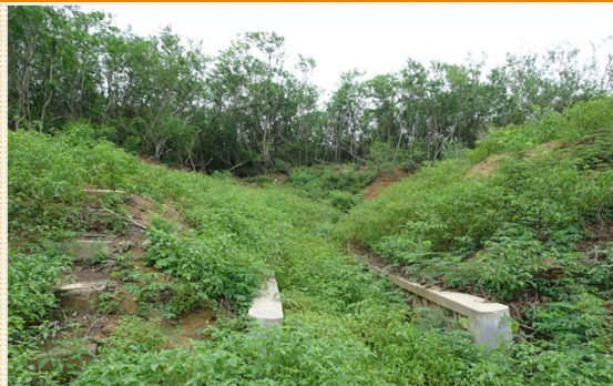
壕溝通道及土坡雜草叢生