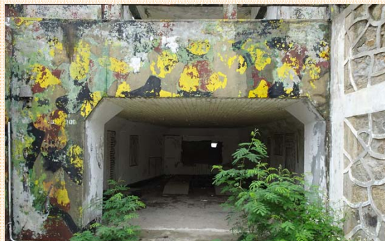
M1式五七戰防砲基座射口