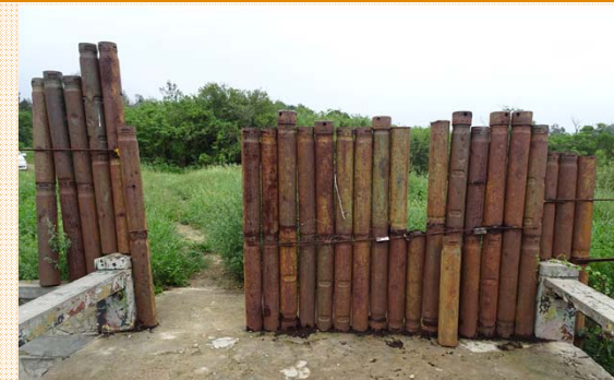
入口處砲彈火藥桶大門損壞