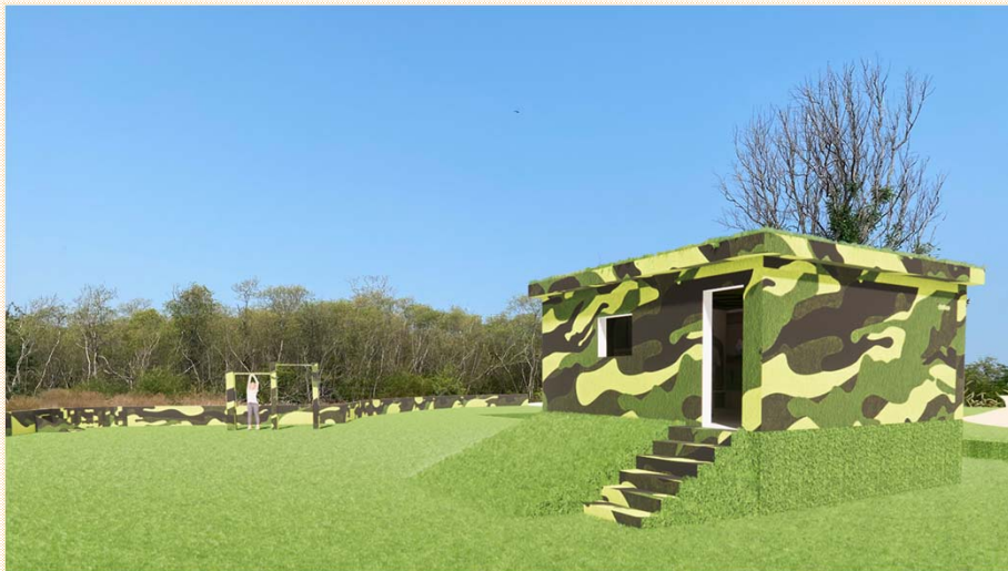
營區廣場改善模擬