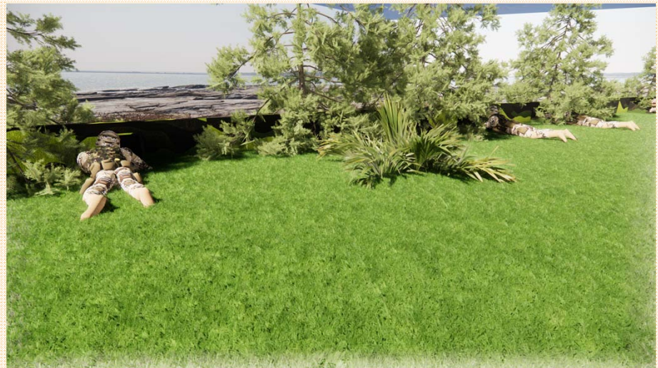
防禦散兵坑復舊模擬