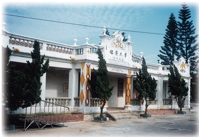
圖 5-1-6-1 銘傳大學金門碩士班校舍