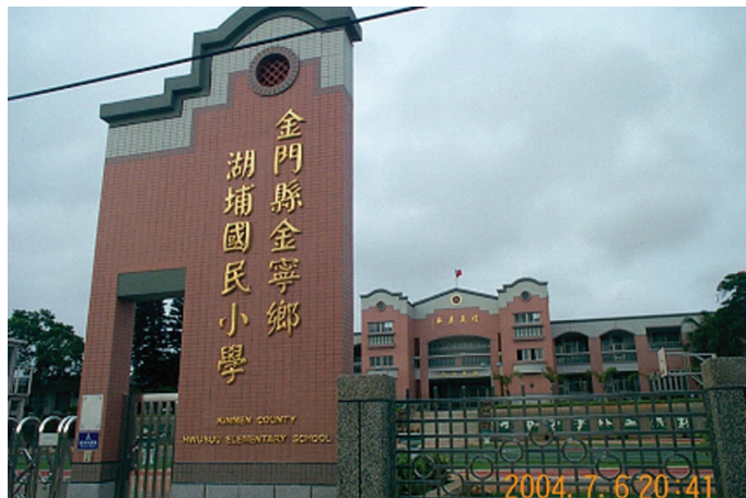
圖 5-1-4-4 湖埔國小