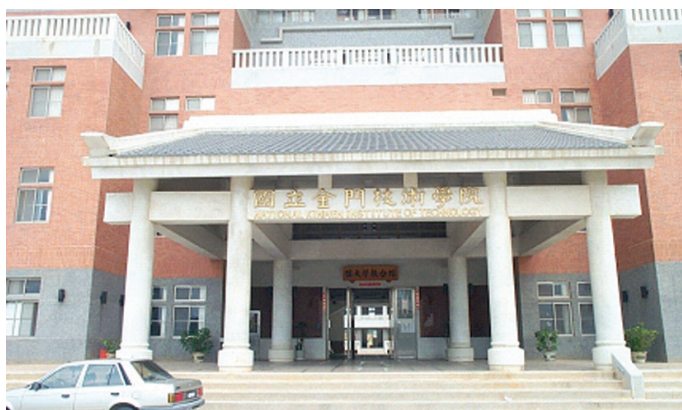
圖 5-1-5-1 國立金門技術學院