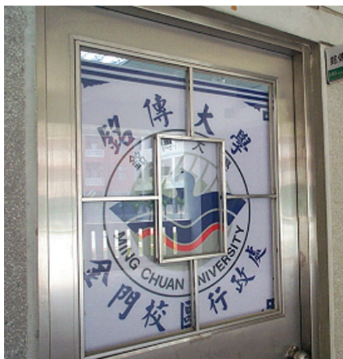
圖 5-1-6-3 銘傳大學金門行政處