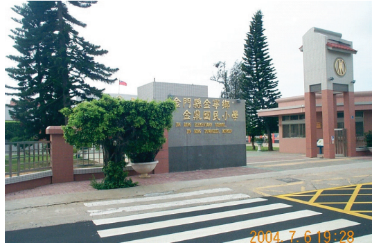
圖 5-1-4-2 金鼎國小