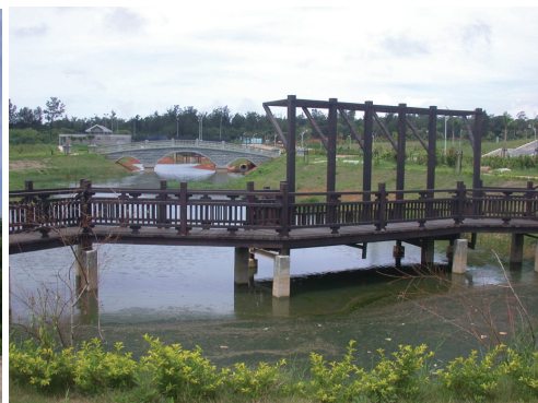
圖 5-1-5-3 校園環境優雅