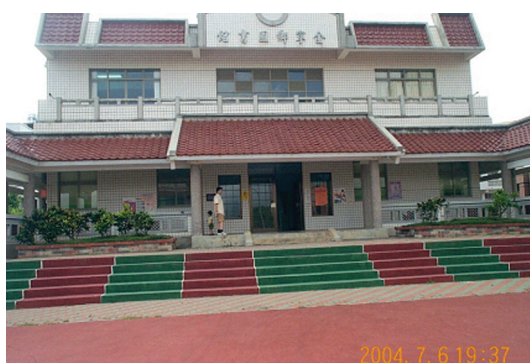
圖 5-1-7-1 金寧鄉圖書館

依據教育部九十一年訂定「公共圖書館設立及營運基準」規定，公共圖書館開放時間，每週以不少於 44 小時為原則。而本館每週開放 48 小時，除每逢星期一及民俗節日不開放外，星期二到星期日，每日上午 8 時至 12 時，下午 13 時 30 分至 17 時 30 分開放；如遇考季，本館即延長調整開放時間為上午 8 時至 12 時，下午 13 時至晚間 21 時，週一及民俗節日不休館仍照