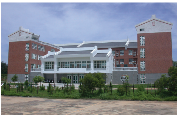
圖 5-1-5-2 學生宿舍

民國九十二年一月動工，樓地板面積七仟平方公尺建築經費新台幣一億元，宿舍一百一十八間，可容納四百五十人住宿，全部工程於九十三年十二月落成啟用。