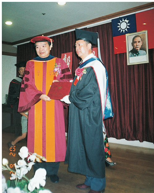
圖5-1-6-2 銘傳大學金門首屆碩士班畢業典禮

大學部原預定於民國九十三年完成首期工程，正式招生，初期計畫設立四系：醫務管理學系、醫療資訊學系、運動保健學系以及觀光學系。嗣因田墩漁塭地質鬆軟，需待填土地基穩固後，始克開工興建而延期。