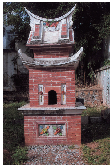
圖 5-1-1-3 浯江書院敬字亭