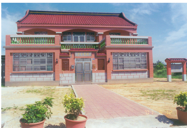
圖 5-1-7-3 增賢書室