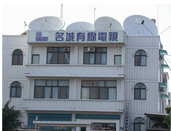
圖 5-1-7-2 名城電視臺