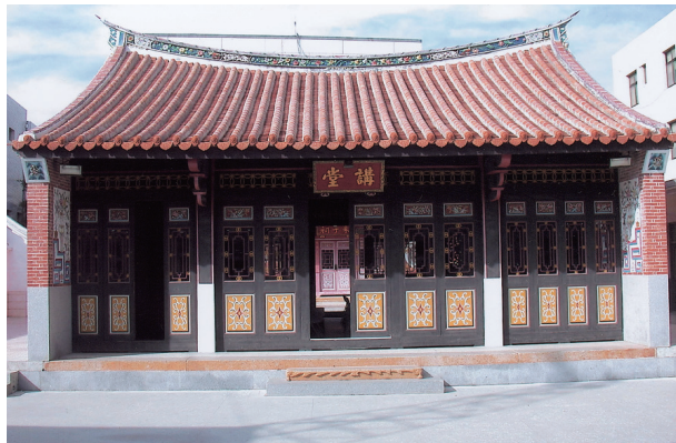
圖 5-1-1-1 金門浯江書院朱子祠講堂