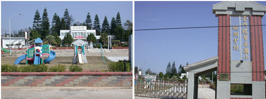
圖 5-1-4-5 埤湖分校