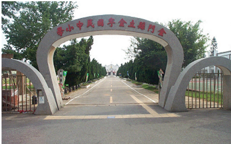
圖 5-1-4-1 金寧中小學