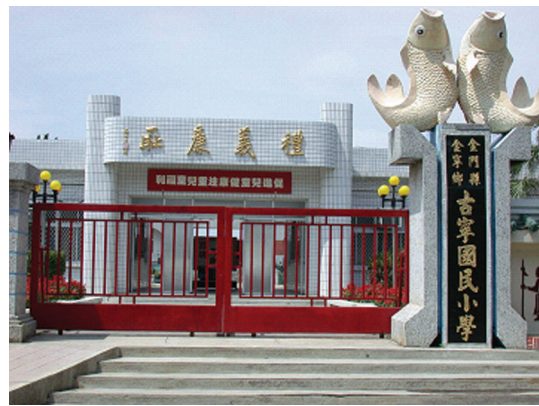
圖 5-1-4-3 古寧國小