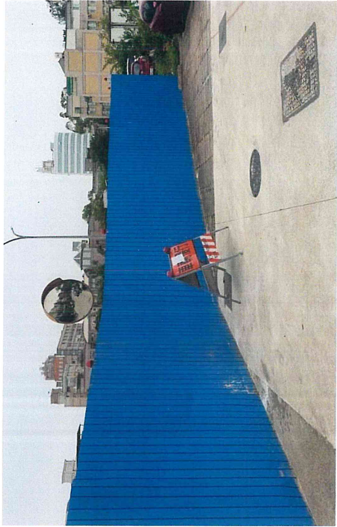
區域一交通維持圍籬，全阻隔式圍籬