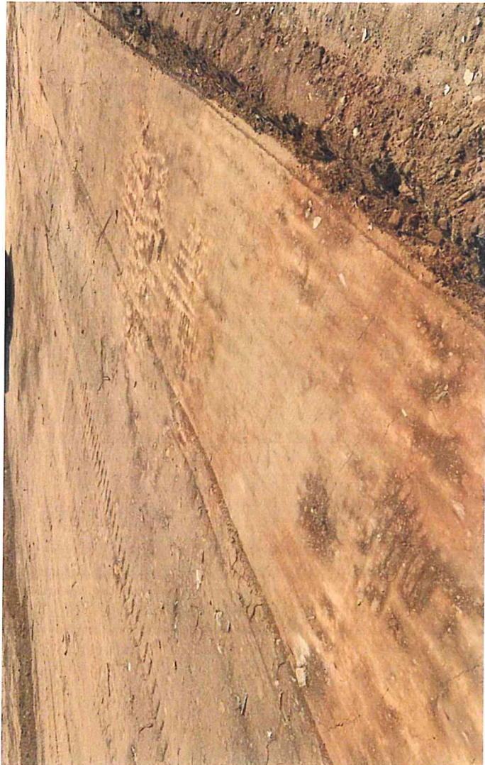
區域一底土夯實整平