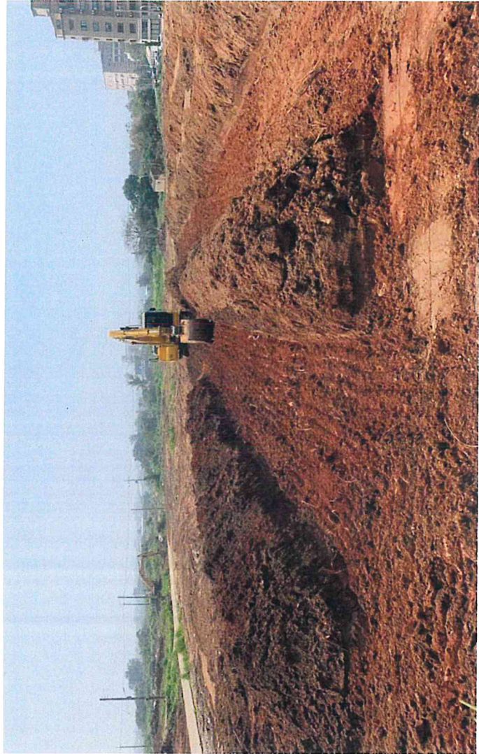
區域一基地及路幅開挖