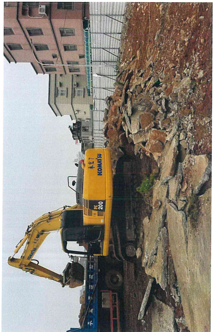
區域二既有建築物及結構物拆除