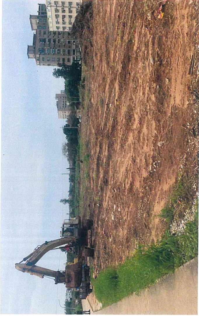
區域一清除及掘除