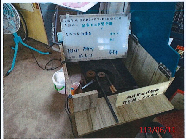
說明：#4鋼筋抗彎試驗中