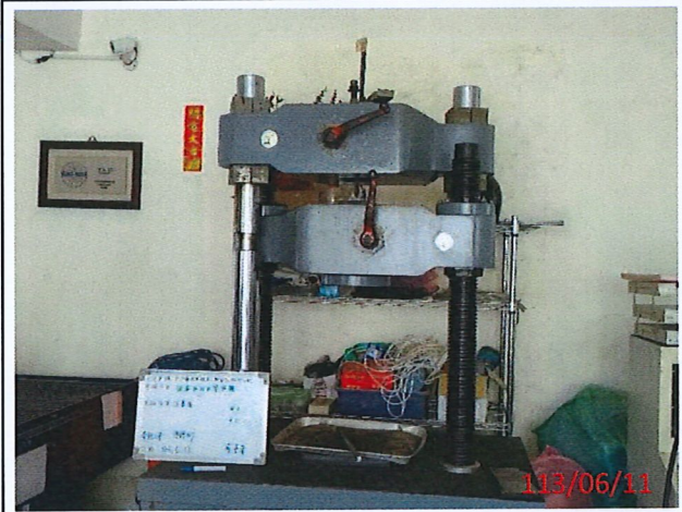
說明：#5鋼筋拉伸試驗中