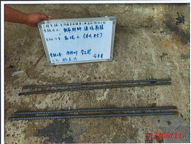
說明：#4、#5鋼筋取樣各二支