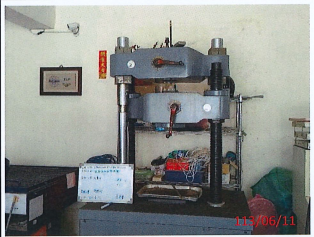
說明：#4鋼筋拉伸試驗中