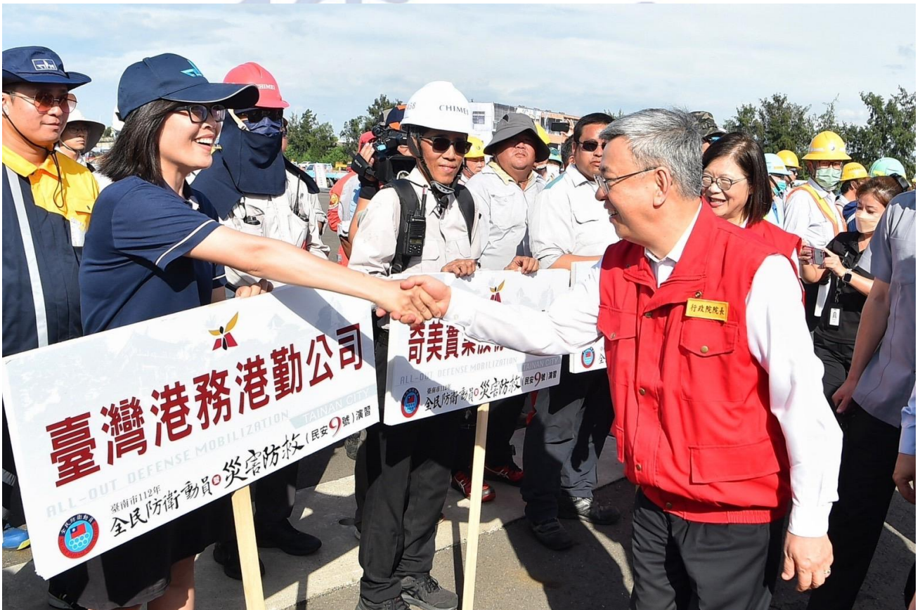
圖1 行政院長陳建仁勉勵臺南市政府民安9號演習參演夥伴

因應國際情勢及威脅，提升戰時災害搶救演練比重，災害防救暨全民防衛動員（下簡稱民安9號）演習重點將戰時境況下各項災害搶救作為項目提升至70%，包括戰時收容救濟站、戰傷醫療體系整備等項目，以檢視全民國防民防力量。執行縣市調整由臺北市、臺中市、臺南市、花蓮縣、臺東縣、澎湖縣、金門縣、連江縣、基隆市、新竹市及嘉義市政府辦理。