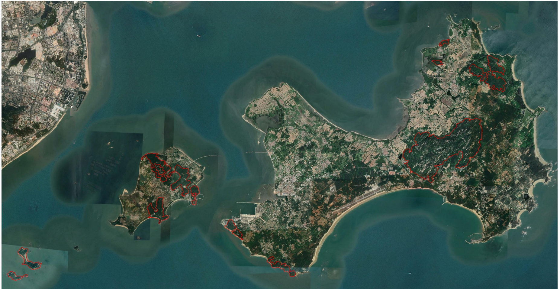
圖 2 金門縣劃定山坡地範圍套疊衛星影像圖