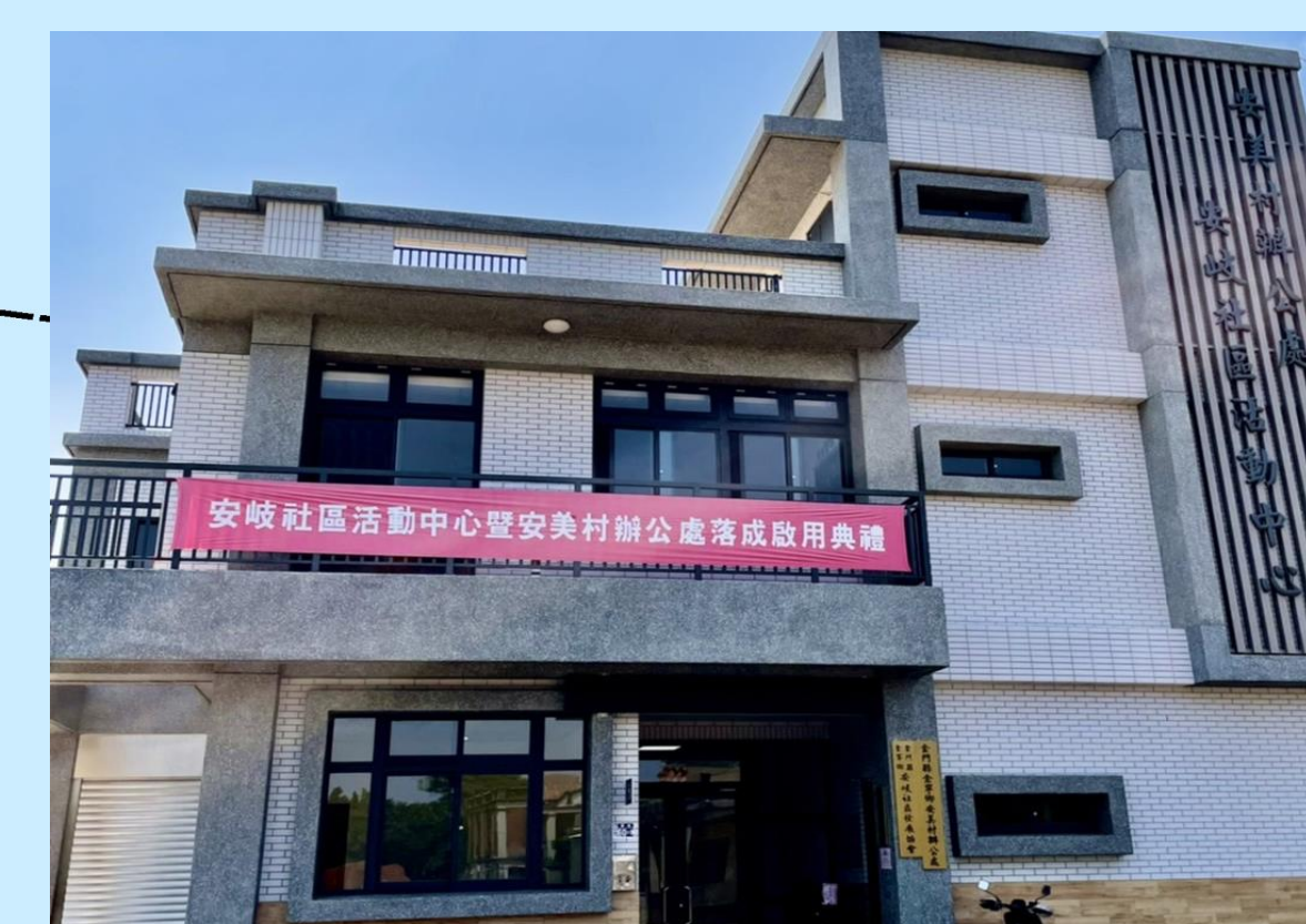
安美村辦公處 適用災害：水災、震災、海嘯