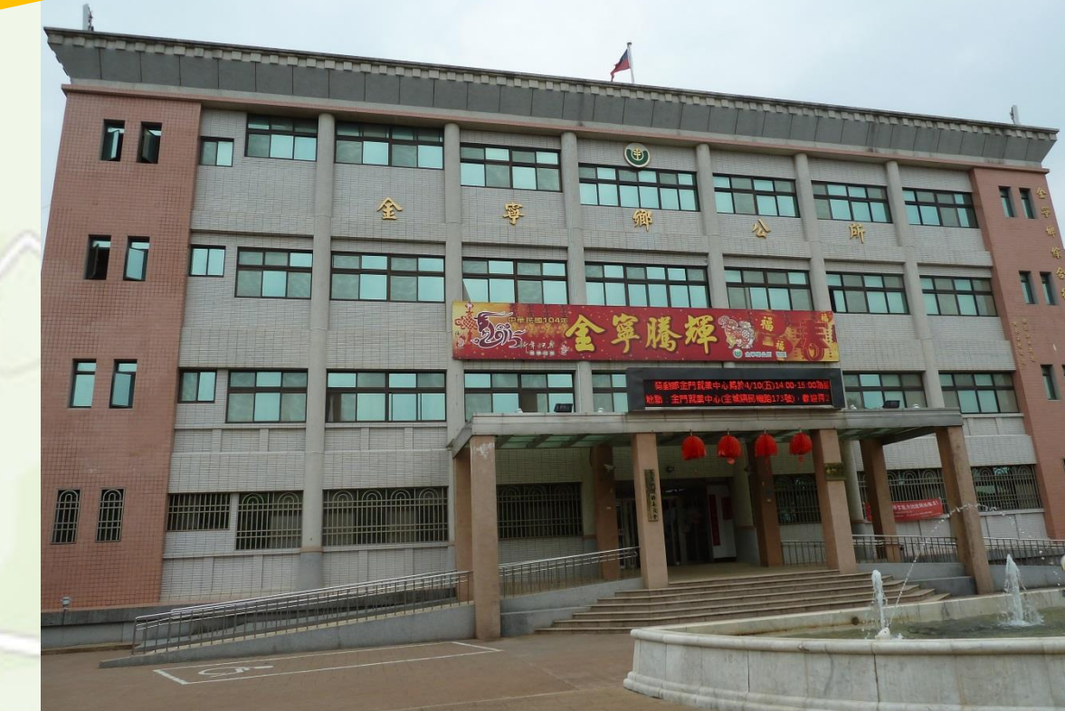
金寧鄉公所 適用災害：水災、震災、海嘯