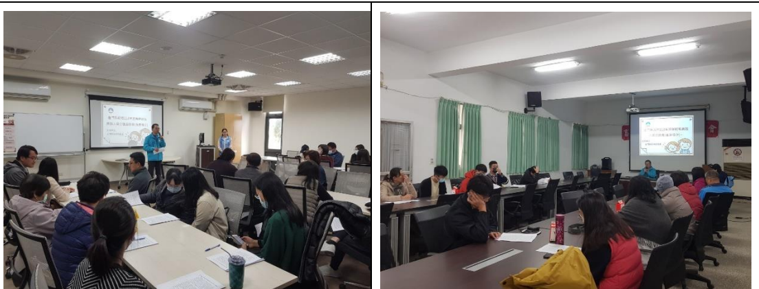
113年2月1日及2日辦理各機關兼辦政風業務人員分區座談會。

辦理兼辦政風業務人員分區座談會，傾聽及蒐集渠等對辦理廉政工作之建議，透過專業講解協助排除所屬機關學校政風工作所遭遇之困難，齊一工作觀念與步伐，建構機關完善內控等防貪機制。