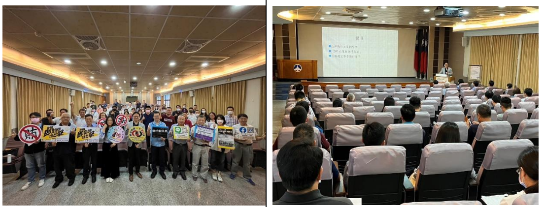
112年10月18日辦理提升政風人員專業能力教育研習活動。

辦理提升政風人員專業能力教育研習活動，邀請福建金門地方檢察署主任檢察官講授「查察賄選案例及技巧分享」，會後並辦理綜合座談，加強本縣專任政風人員及各機關學校兼辦政風業務人員之本職學能。