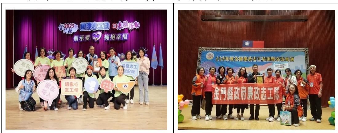
112 年 12 月 2 日榮獲本縣 112 年度績優志願服務團隊(目的組)第一名；113 年 3 月 29 日「113 年度全國廉政志工培訓暨交流會議」志工創意展演活動榮獲銅嗓獎(第三名)。

(三) 參與本縣「112 年度績優志願服務團隊選拔」，榮獲 112 年度績優志願服務團隊(目的組)第一名，於 112 年 12 月 2 日「慶祝 2023 年國際志工日暨表揚活動」受頒；另今(113)年 3 月 28、29 日參與「113 年度全國廉政志工培訓暨交流會議」活動，並在志工創意展演活動中榮獲銅嗓獎(第三名)佳績，除藉以激勵廉政志工，促進標竿學習，凝聚團隊向心力，且提升整體志願服務品質及行銷縣府施政量能。