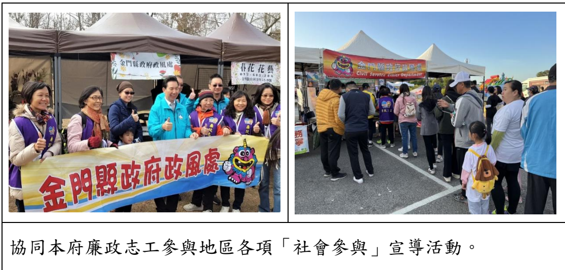
協同本府廉政志工參與地區各項「社會參與」宣導活動。

(一) 協同本府廉政志工參與地區「金酒盃接力賽」、「社福盃健走活動」、「移民節嘉年華」、「本縣林務所迎新春假日花市活動」、「南門里 113 年迎新春贈春聯」、「2024 金門馬拉松」、「2024 石蚵文化季」等活動，落實社會參與廉政宣導，以活潑有趣的宣導教具，提升民眾對廉政主題的認識。