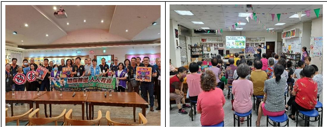
辦理第 16 屆總統副總統及第 11 屆立法委員選舉反賄選宣導。

(三) 參與本縣「112 年度績優志願服務團隊選拔」，榮獲 112 年度績優志願服務團隊(目的組)第一名，於 112 年 12 月 2 日「慶祝 2023 年國際志工日暨表揚活動」受頒；另今(113)年 3 月 28、29 日參與「113 年度全國廉政志工培訓暨交流會議」活動，並在志工創意展演活動中榮獲銅嗓獎(第三名)佳績，除藉以激勵廉政志工，促進標竿學習，凝聚團隊向心力，且提升整體志願服務品質及行銷縣府施政量能。