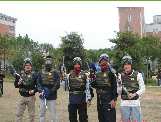
▲本局特派五位精英，賽前參加模擬戰，成績「斐然」

「連日陰雨終放晴，遠離毒害漆彈營，深化青年反毒觀，昌隆社運起步行」，101年11月25日，本局刑事警察大隊假金門大學圖資大樓前場地，與福建金門地方法院檢察署、國立金門大學及本局各分局等單位，聯合舉辦「遠離毒品，魅力四射——漆彈競賽」預防犯罪宣導活動，活動宗旨係以正當之競賽運動宣導地區民眾（尤其是青少年）反毒品之意識。