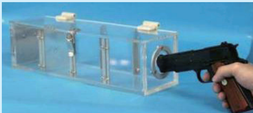
▲動能檢測箱測試（刑事局刑事雙月刊48期，33頁）