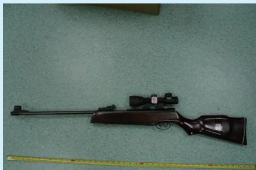
▲壓縮彈簧帶動活塞壓縮氣體之空氣槍