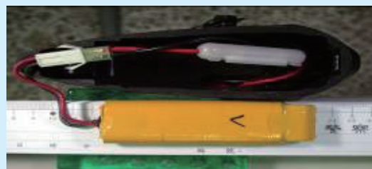
▲拆解槍枝之握把或槍身可發現其內具串聯電池及線路接頭