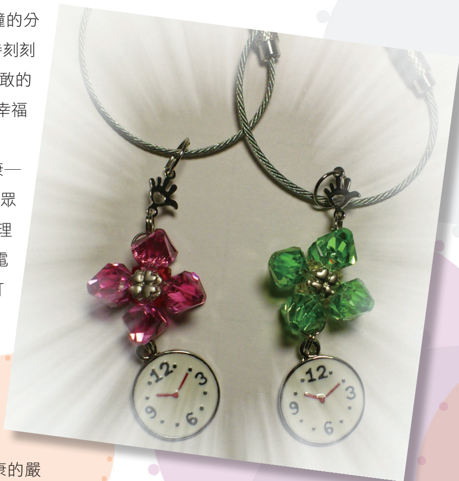
▲實作成品精美大方

爾後本局仍將廣續辦理是類預防犯罪宣導活動，期望讓民眾能有更多保護自己，免於受害的觀念，本次活動也感謝各分局同仁的全力協助與配合，讓活動能圓滿順利達成。