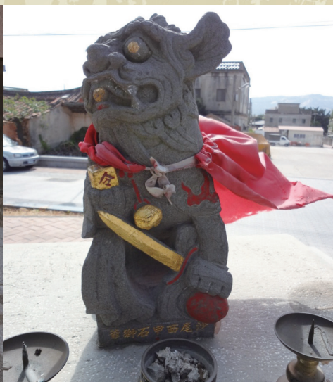
▲沙青路進入萬安堂入口處一金門唯一配劍的風獅爺