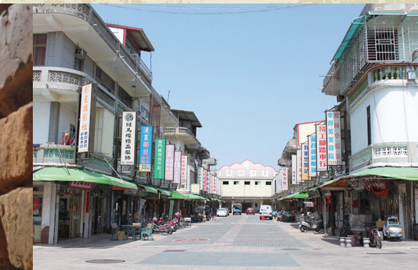
▲落寞唯一的金沙戲院一回味無窮