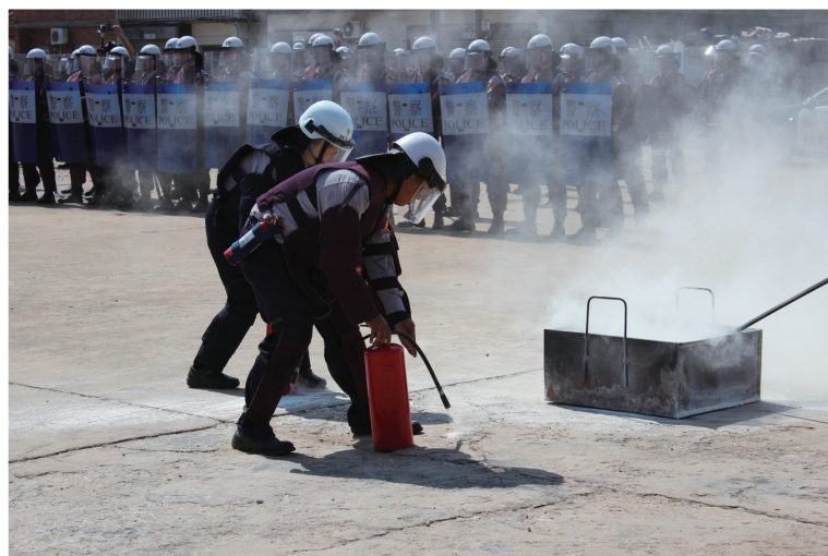
▲女警支援滅火一隅