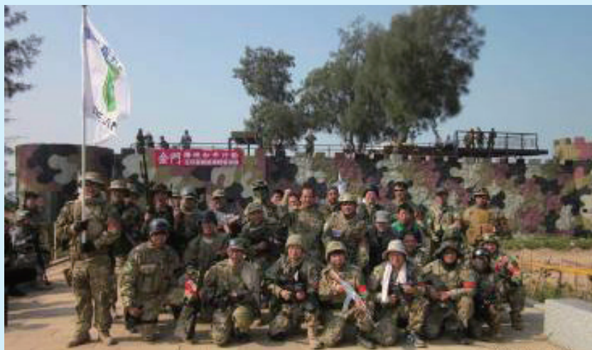
▲金門縣生存遊戲協會

近來地區興起生存遊戲活動，同時獲得縣長李沃士響應支持生存遊戲運動的發展，希望能打造戰地旅遊的品牌，吸引更多年輕朋友的前來金門觀光旅遊和體驗生存遊戲的刺激無比，然地區仍有少數民眾持改造空氣槍枝把玩，影響社會治安，是否具有殺傷力也有待商榷。因此本局自97年10月份依內政部警政署函頒之「氣體動力式槍枝（空氣槍）動能初篩計畫」，成立小型實驗室，用「動能檢測箱」來測試空氣槍是否超過法令殺傷力之標準，以藉此提供民眾政令宣導與員警查緝空氣槍之SOP處理流程。