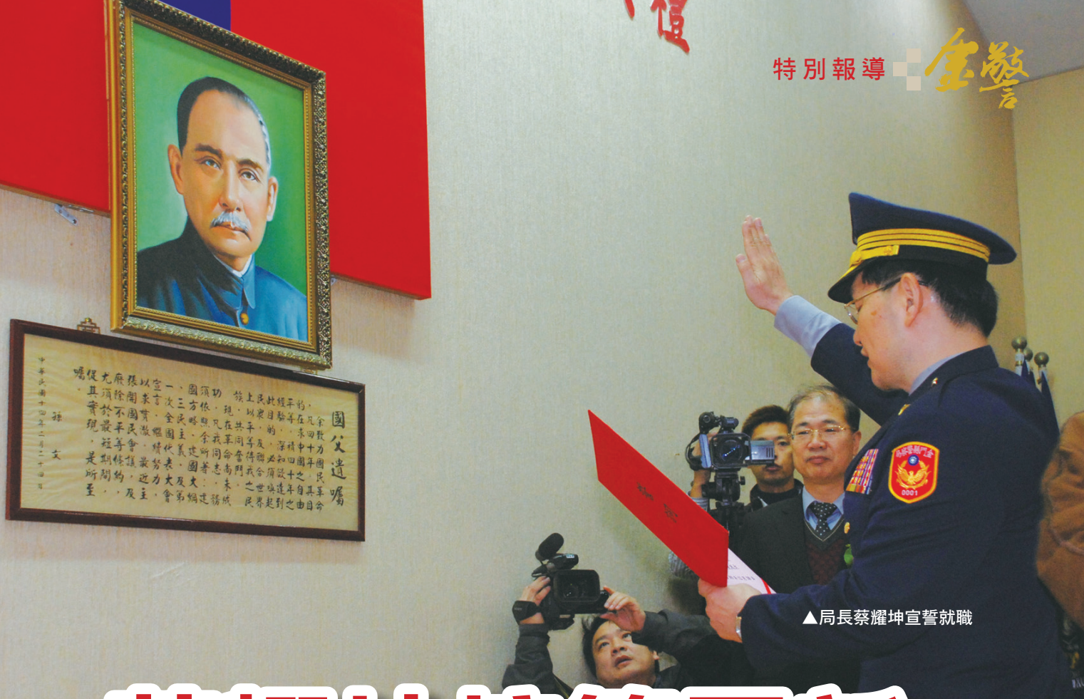
▲局長蔡耀坤宣誓就職