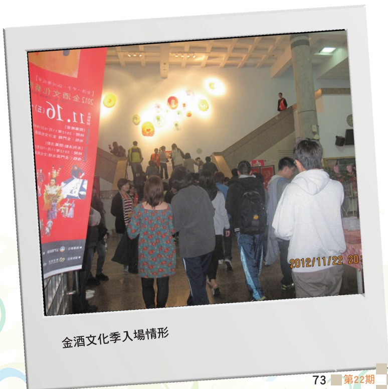
金酒文化季入場情形

就我而言，凡事「用平常心看待順境與逆境」，生活本來就是吉凶參半，「與人敵對，不如並肩向前」，在警察職場上想鎖定對抗的敵人不難，但要找到適合的夥伴卻不容易，與對手化敵為友，微笑