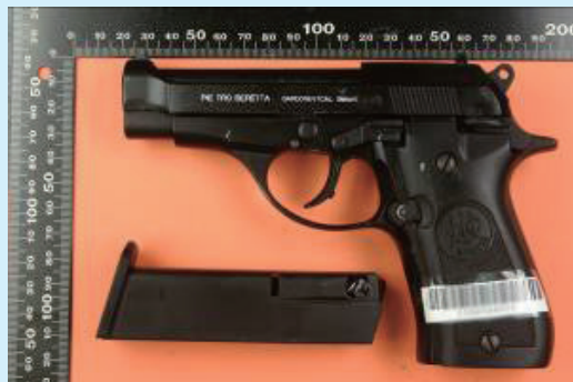
▲仿BERETTA廠半自動玩具手槍