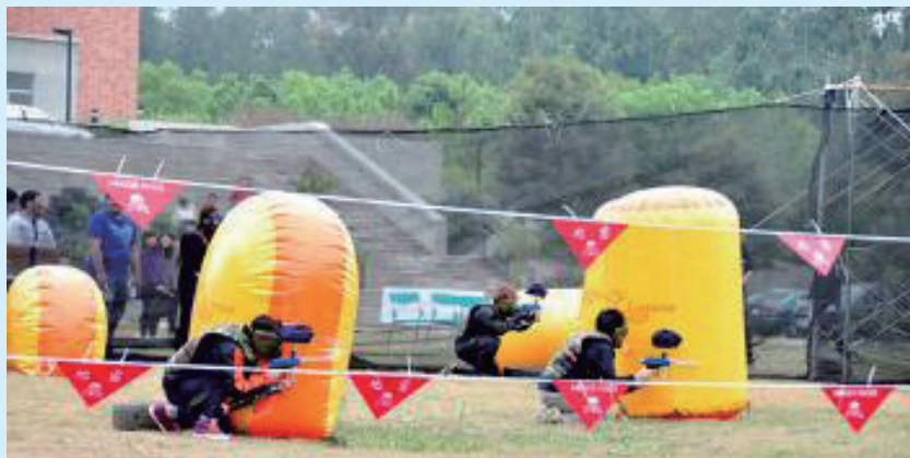
▲本局舉辦犯罪預防宣導-漆彈比賽