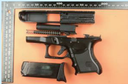
▲仿GLOCK廠半自動玩具手槍

如有查獲具有小型二氧化碳鋼瓶、外接二氧化碳高壓鋼瓶及改造槍管內不具阻鐵之玩具槍枝，均可能認定為具有殺傷力。