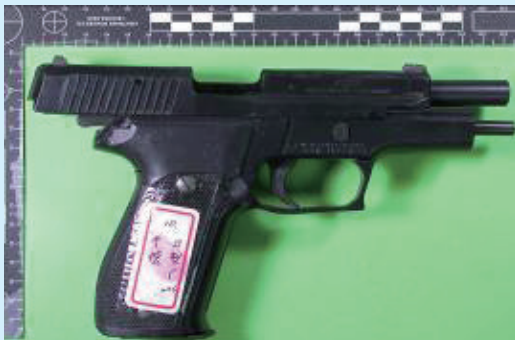
▲槍枝零組件（槍身、滑套、槍管）材質大多為塑膠，槍管內具金屬襯管