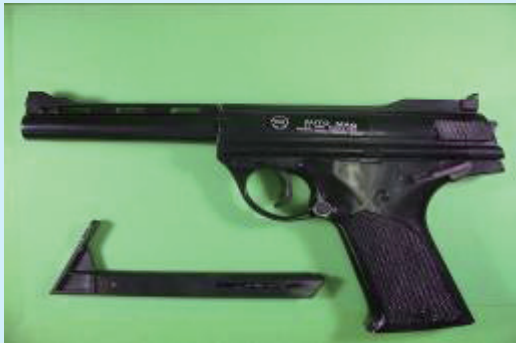
▲彈匣不具裝填一般子彈之功能，僅能裝填彈丸