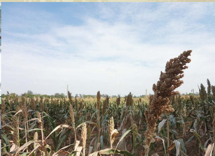
▲環島北路的高粱田