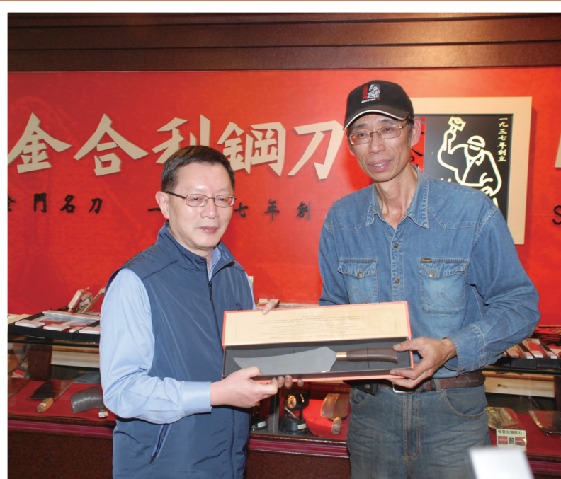
▲國寶級人物「吳師傅」相贈署長現打勇士刀，以為蒞金紀念