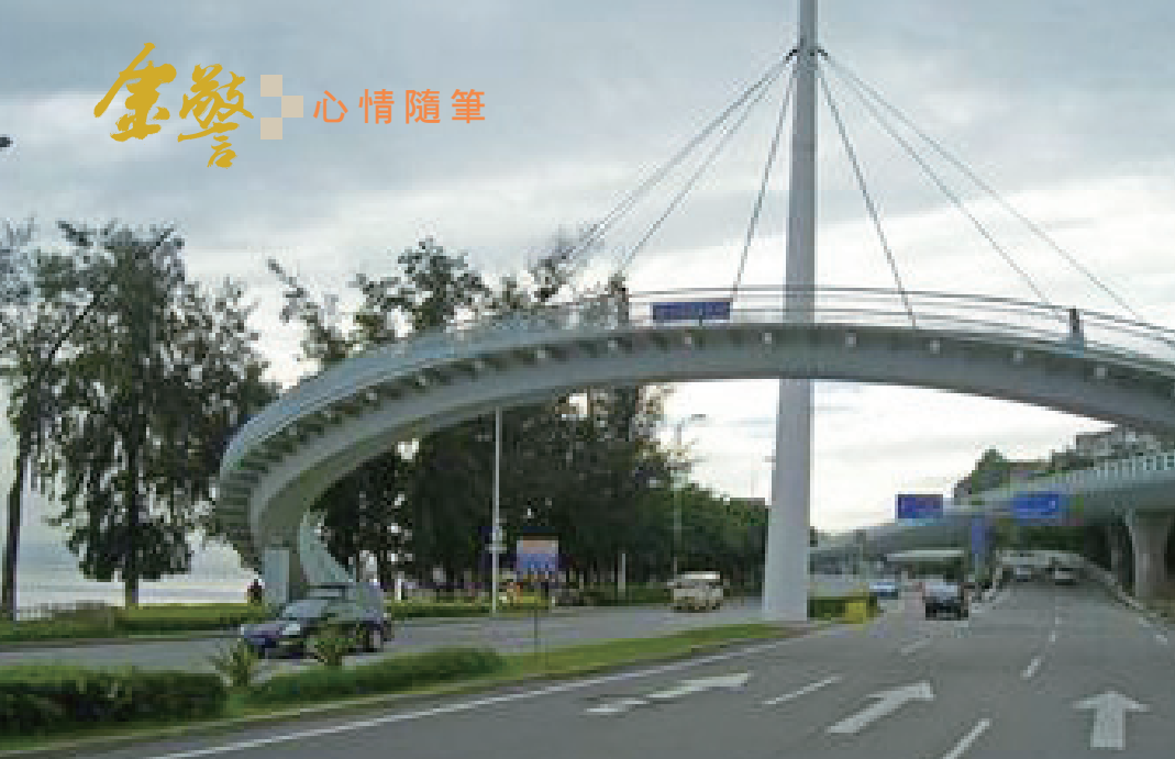
◀廈大白城落日餘暉