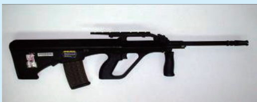
▲彈匣不具裝填一般子彈之功能，僅能裝填彈丸