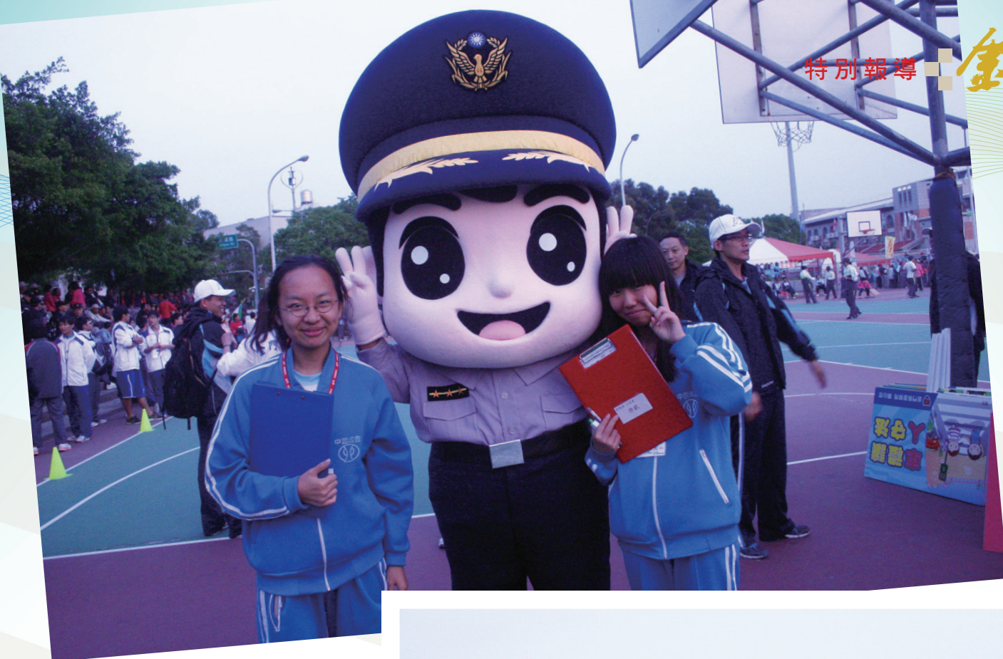
▲警察寶寶—人型布偶