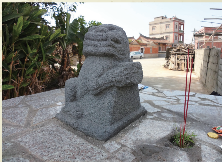
▲忠孝新村後方--風化許久的石雕風獅爺