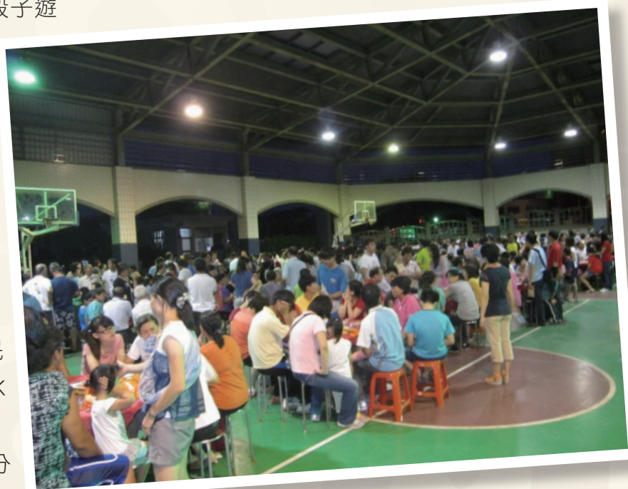
▲參與活動人山人海

中秋博狀元餅已成為金門最夯的秋節民俗活動之一，總是出現萬人空巷的盛況，博餅活動除了讓民眾、觀光客體驗地方民俗活動外，更應讓參與的群眾了解博餅的歷史意義和文化意涵。畢竟民眾的高度參與，才是讓觀光活動能否永續的根本，「金門最美麗的美景，是文化」，包含戰地、閩南、僑鄉文化，當想像的彼岸變成了真切的對岸時，透過與金門息息相關的文化活動來創造金門的觀光產業，朝無煙囪觀光休閒產業發展，總勝於開放博奕增加盈收，對後代子孫更具傳承意義。金門的未來是否繼續榮登幸福城市、是否仍是遊客記憶中的美麗城市，是每位鄉親應堅持、捍衛與努力不懈的課題。