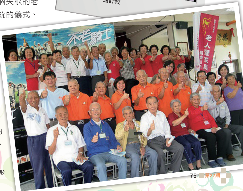
▶ 不老騎士拜訪情形