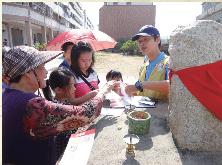
▲隱身金沙國小旁的風獅爺一連老人家都踴躍發問