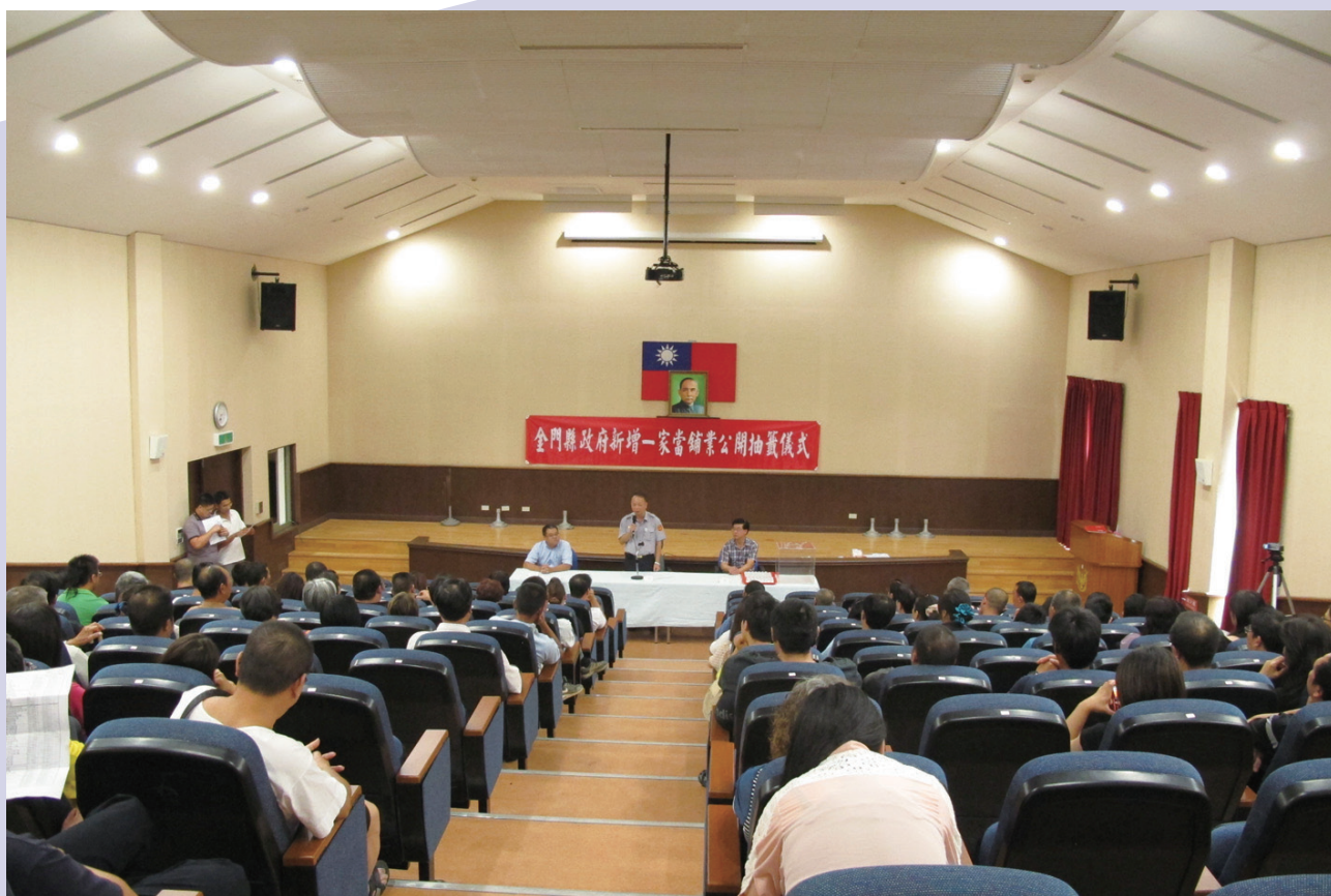
▲抽籤現場，競逐者眾

金門縣自90年6月8日當舖業法頒布之前，原轄內僅有誠○當舖一家，99年1月底轄內設籍人口增加至3萬人以上，本局秉持「公平、公正、公開」原則辦理新增當舖一家，並順利由夏○當舖（現更名為三○當舖）取得許可證。至101年4月底，本縣受惠於各項利多政策加持下，致使轄內設籍人口快速增加，超過105,950人口再新增一家當舖之門檻，本局爰依當舖業法、當舖業申請籌設勘驗及設立許可辦法、金門縣政府辦理當舖業申請籌設核發同意書執行要點等相關規定，辦理新增一家當舖工作。