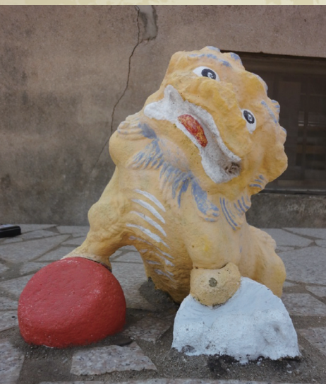
▲沙美老街旁--日月星辰(左為日.右為月)保護的彩色風獅爺