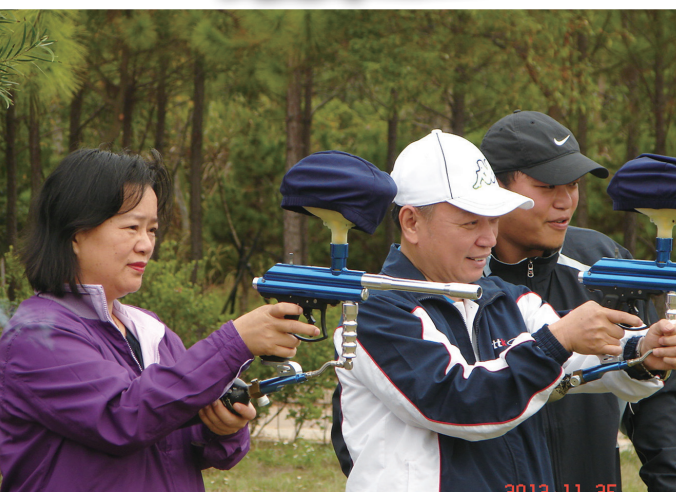
▲射擊體驗區魅力無窮，許議員與局長開懷感受扣板機樂趣！