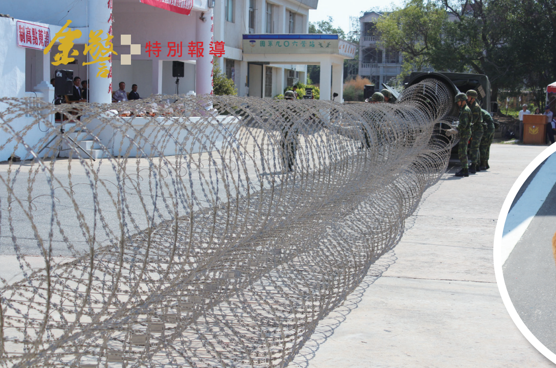
◀金防部架設鐵絲網 ▼連土狗也來湊一腳