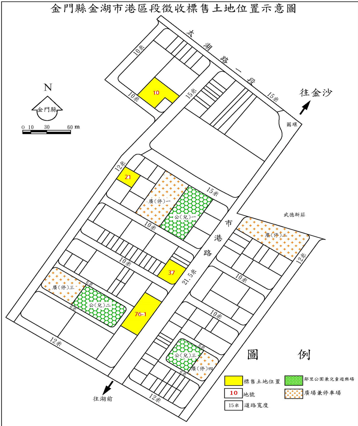
金門縣金湖市港區段徵收標售土地位置示意圖