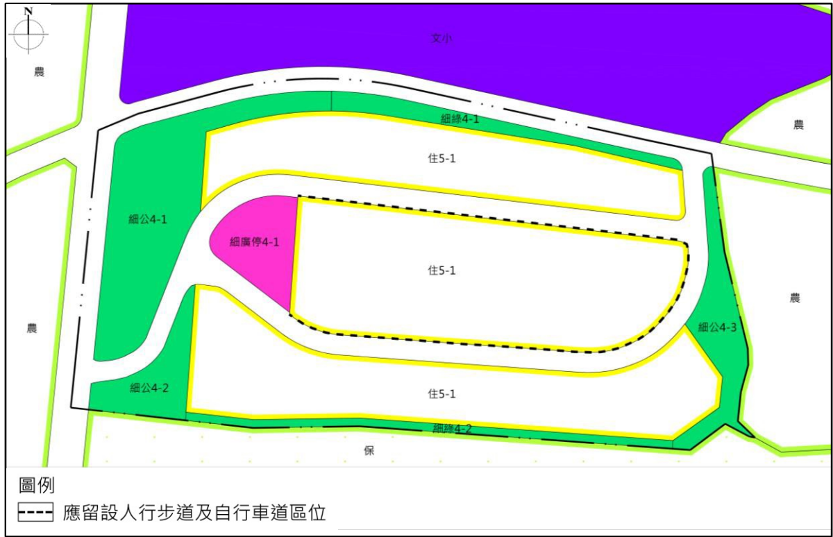
圖 6-7-1 通盤檢討後住宅區留設人行步道及自行車道區位示意圖