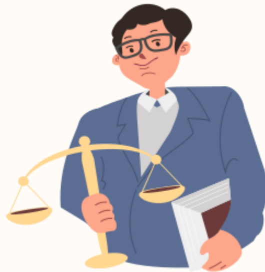
專家諮詢/資源整合