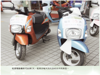
租賃電動機車可以來天，租車每天30元及45元不等車種。

並在縣府行政園區和火車站劃設免費專用停車格及全縣218個充電設施 還可至16經銷商免費換電池