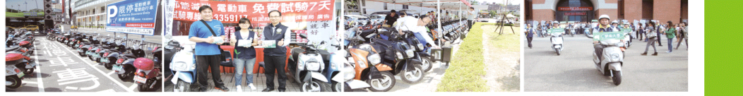
租車火車站在經銷商試騎服務站及電動自行車專用停車位，且免費換電池。還有政府之指示牌「一拖一拖」機車和自行車專用停車位，將予換裝。

插電式油電複合車更實用。環保局長陳志強表示，打掃城市一直是桃園縣的政務目標。目前由捷運巴士目前的電動公車，不僅省油、省錢，且能減少二氧化碳排放。此外，該局在火車站劃設試騎站，除免費試騎外，並提供民眾免費換電池服務。