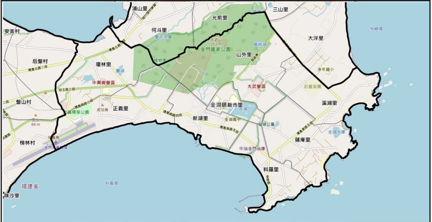
金門縣金湖鎮24小時累積200毫米淹水潛勢圖