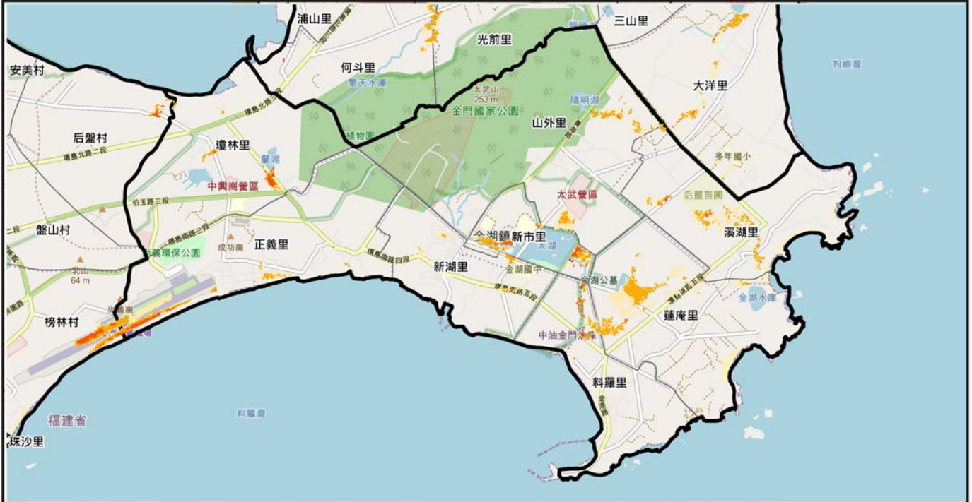
金門縣金湖鎮24小時累積500毫米淹水潛勢圖