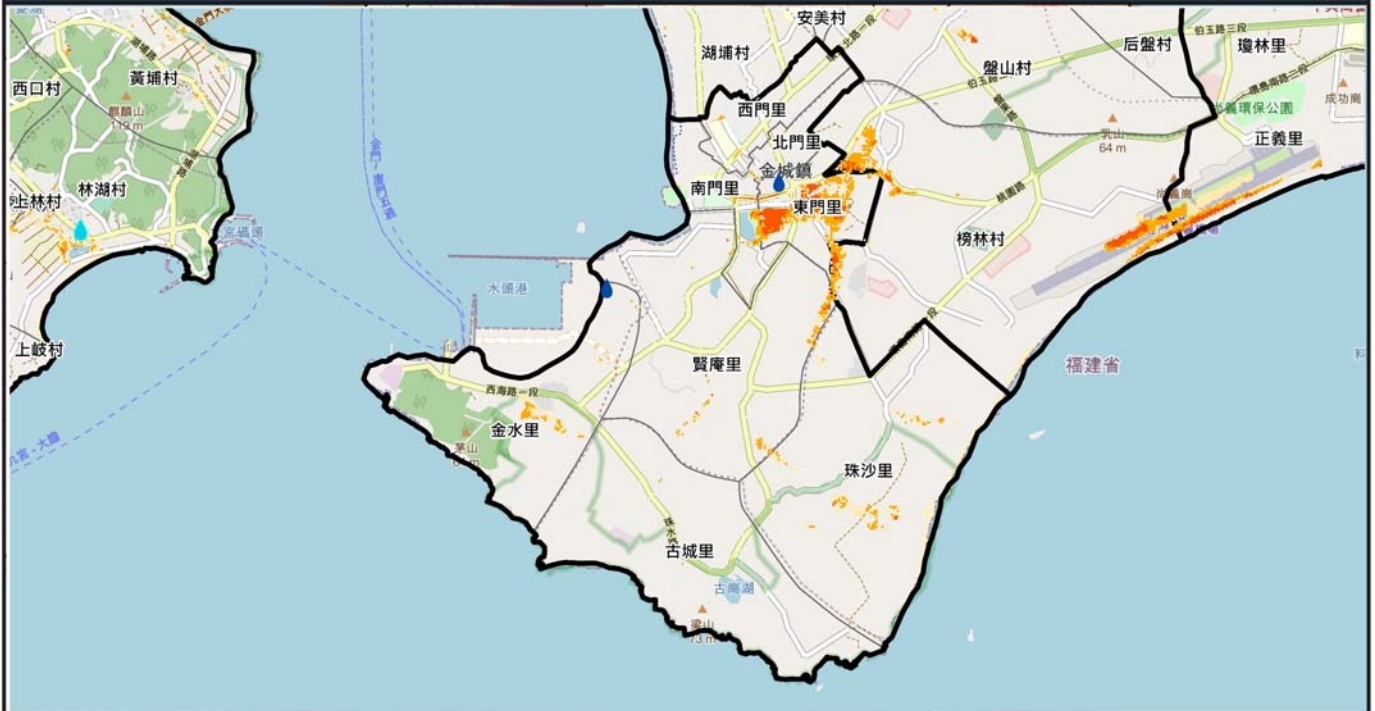
金門縣金城鎮24小時累積500毫米淹水潛勢圖