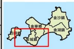
金門縣金城鎮12小時累積200毫米淹水潛勢圖