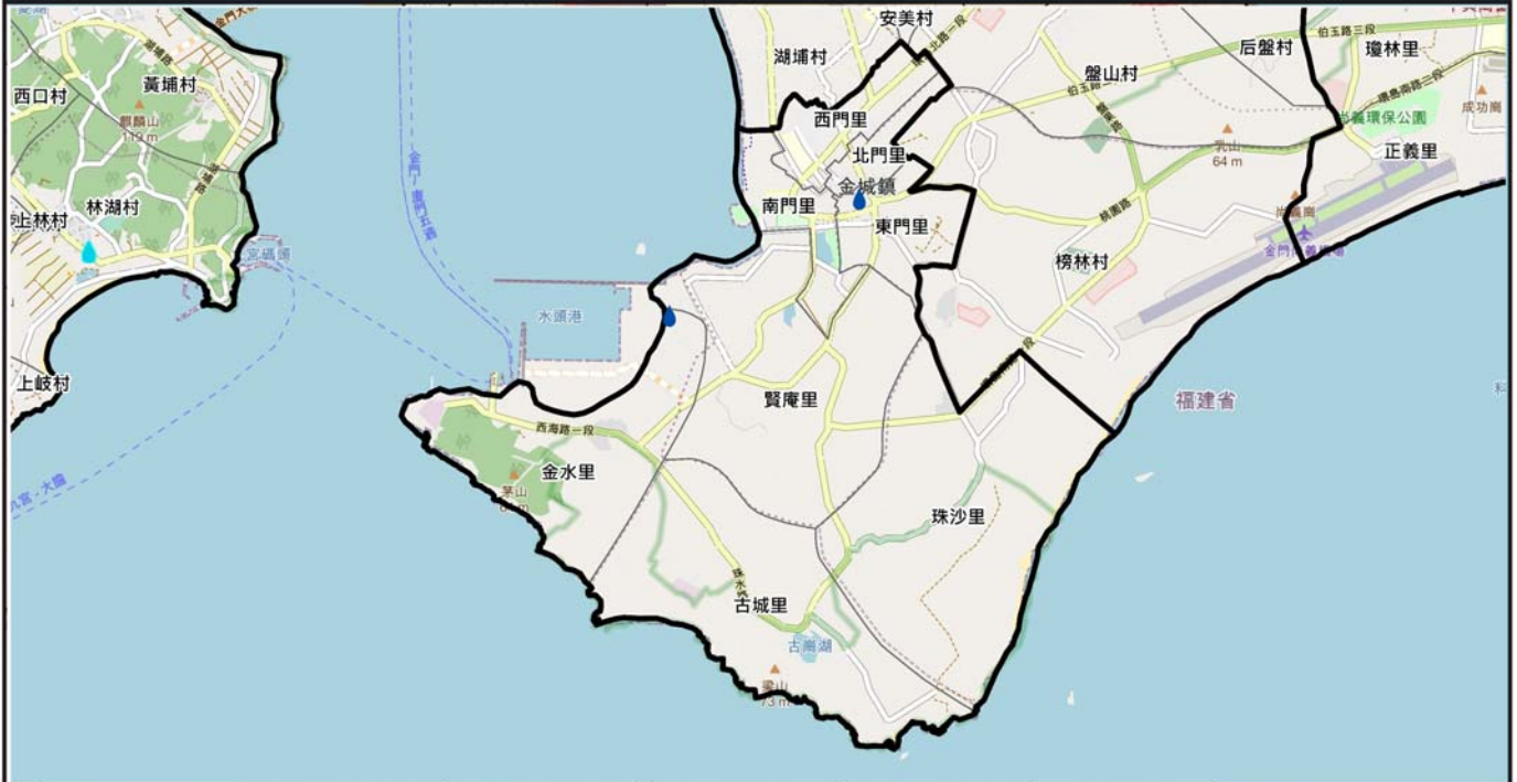
金門縣金城鎮24小時累積200毫米淹水潛勢圖