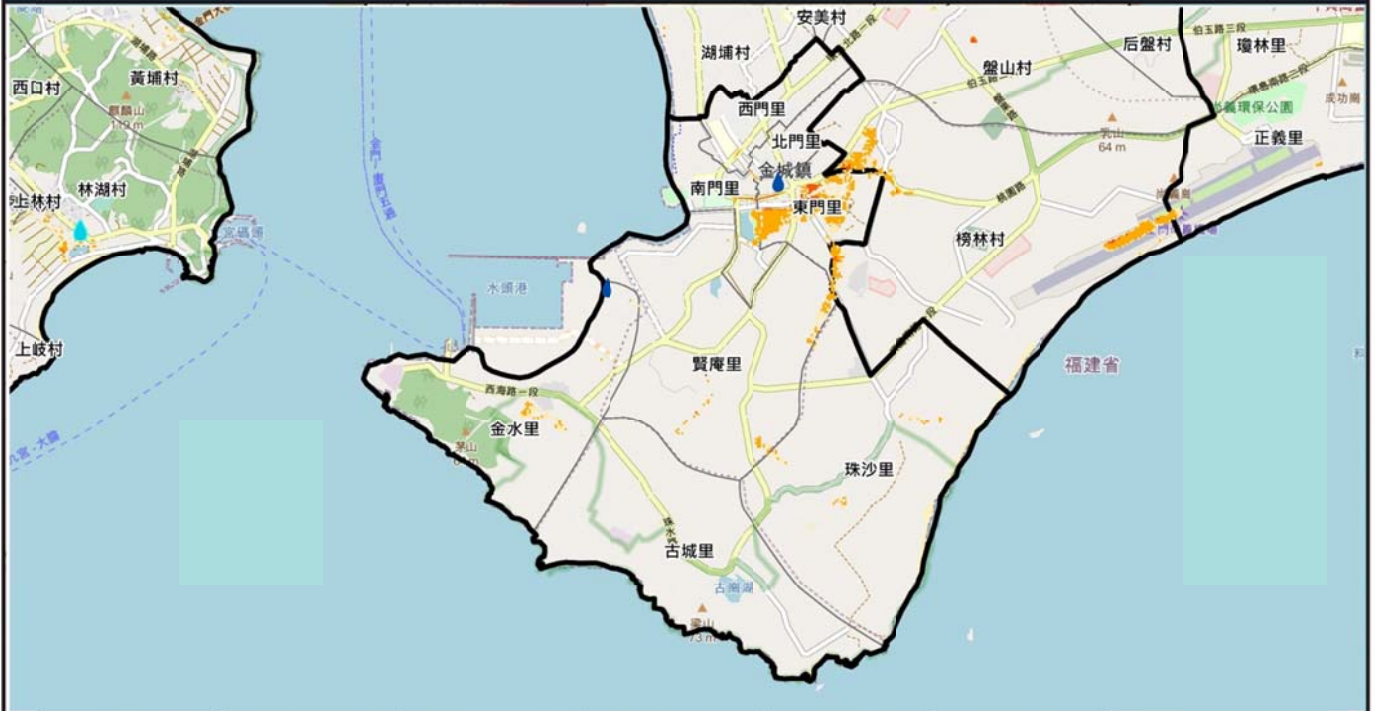
金門縣金城鎮6小時累積350毫米淹水潛勢圖