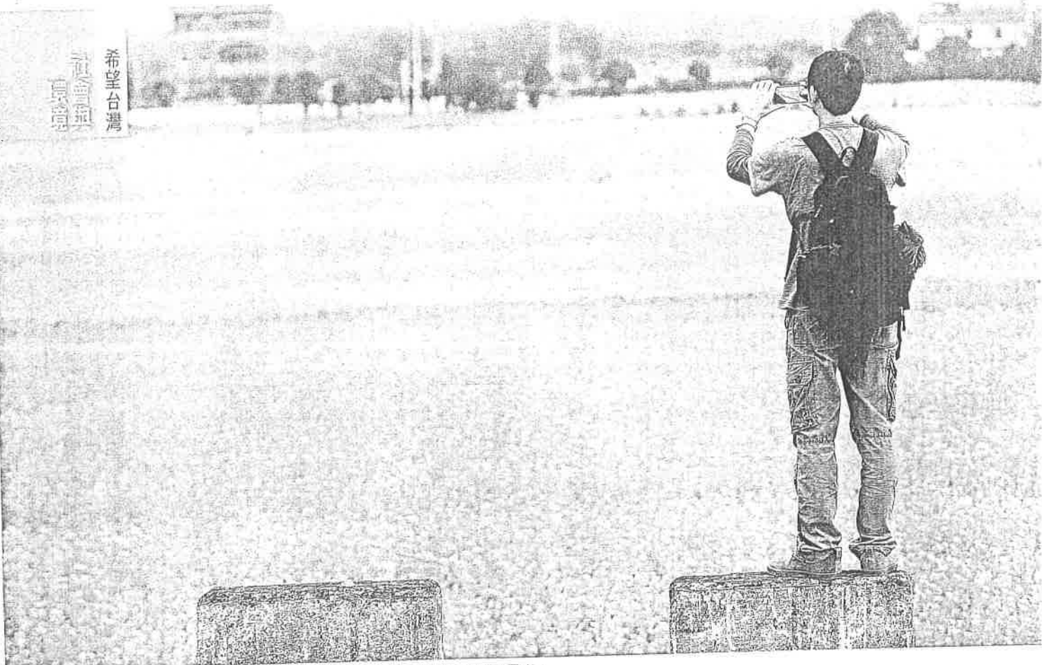
▲錯過現代化的鳳林鎮，沒有工業，卻能享受各種各樣的田園風光。