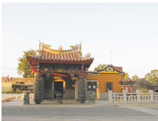
圖10-10 位於賢厝的泰安宮。

中華民國八十四年歲次乙亥陽月吉日 <賢聚泰安宮重建捐款芳名錄> 中華民國八十四年歲次乙亥陽 月吉日立(略)。