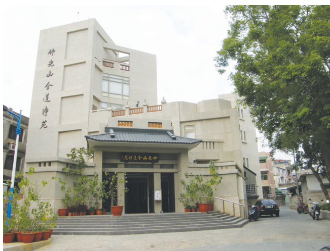
圖10-1 金蓮淨苑是金城鎮重要的佛寺。

盧若騰官兵部主事時，會閣臣楊嗣昌，督師湖廣，請刊布華嚴經祈福，若騰即疏參嗣昌不能討賊，只圖佞佛，煽惑愚民，怪誕不經，時論壯之。