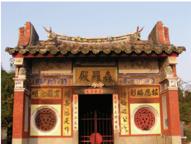
圖10-7 位於省政府旁的森羅殿舊貌(已重建)。

附：昭忠祠在後浦渡頭，毗連天后廟，嘉慶間總兵許松年建，祀海上陣亡浙江提督壯烈伯李長庚，定海鎮羅江太、溫州鎮胡振聲、廣東平海參將王國泰、海明參將陳名魁、烽火守備黃志輝，台協中營把總許攀桂，外委武國樑、李合成及死事軍士，道光元年重修，今圯。原位於省府廣場不鏽鋼銅雕附近，為二落建築。