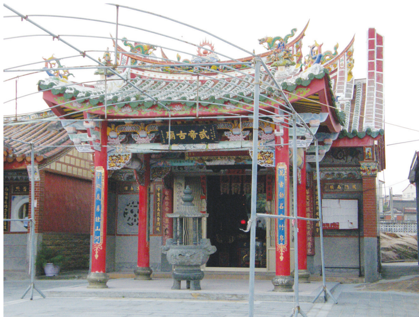
圖10-14 關公信仰在金門甚為普遍，一般簡稱「武廟」，圖為金門城之關帝廟。