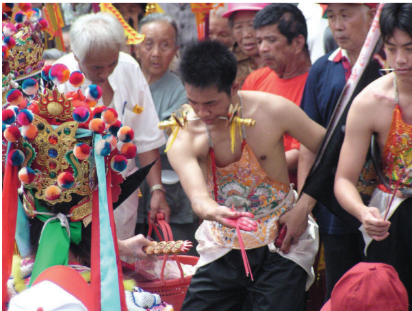
圖10-8 乩童為神社傳神意之靈身，隨著現代化的過程現已逐漸凋零。