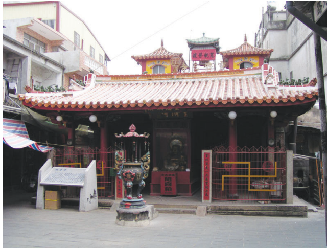
圖10-2 年代久遠的觀音亭主祀佛祖，屬於佛教信仰。

地方老叟嫗媪，每月朔望及齋期，與金城蓮友相互往來唸經禮佛。又安老為亦有唸佛會，院內有佛堂一所。