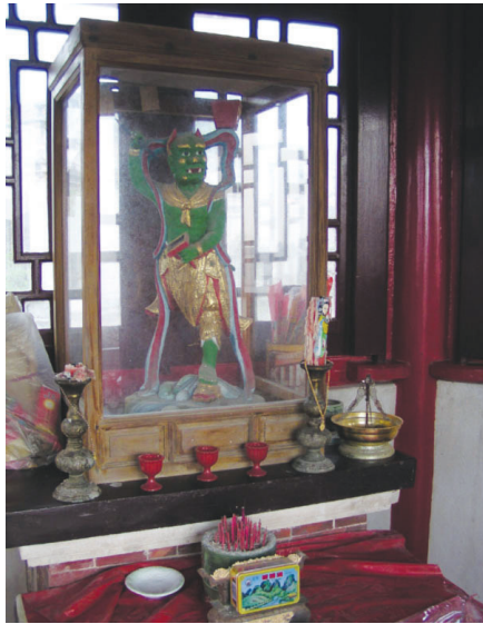
圖10-5 奎閣裡祀奉著魁星爺，乃舊時求取功名時的信仰。

地區為維護文物勝蹟，特專案爭取內政部資助貳佰萬元，邀名建築師漢寶德先生規劃設計，於七十五年六月十六日鳩工興建，歷時半載，盡復舊觀，其周邊環境亦力求美化，藉供瞻仰遊憩、寓化育薰陶於境教而勵志學匡時焉！修葺既成，特為立誌記之。