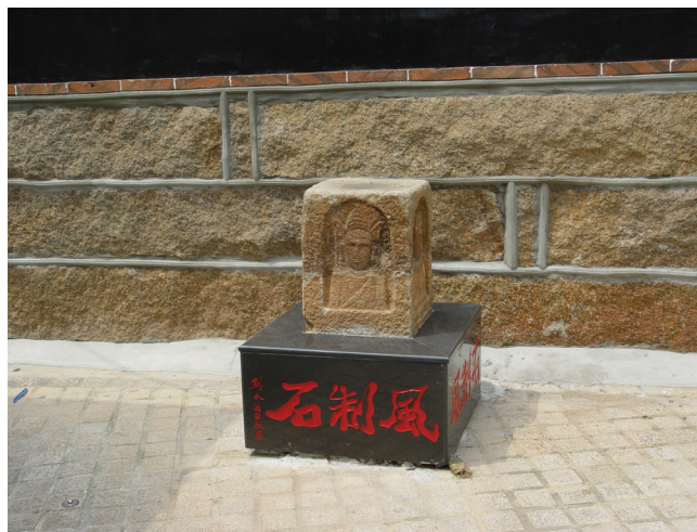
圖10-17 風制石亦是居民用來對抗風災的信仰。

前世親魂：浯俗民家婦女，遇有家人不安，為周期性或間性惡病纏身，久治不愈，常就教於巫覡三姑乩童，謂係前世親魂糾纏所致，所謂親魂悉為前世父母，前世兄弟，前世子女，而以前世夫妻為最多。須為其妝金身偶像，另龕供奉於廳堂案上，擇定日期為其忌辰，每歲為期祭祀，可獲平安。其偶像多為古裝，形狀大小悉依乩巫所囑規定，或木雕，或以綢布紙料表裡妝塑，事雖屬迷信，然其雕塑精美，尤其綢布紙料所妝者，頗具民間藝術價值。