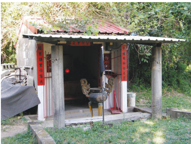
圖10-11 愛國將軍廟是金門特有的信仰，圖中廟的位址於鳳翔社區外。