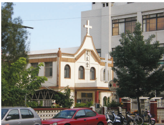
圖10-4 天主教堂位於金城車站附近。

依據維基百科的記載：天主教（英語：Catholicism），又稱公教，但是自明朝時就沿用的名稱“天主教”，已成了正式的中文代名詞（因其將不使用上帝、神等辭彙稱呼所信仰的天主，而僅使用天主一詞）。在基督教的所有公