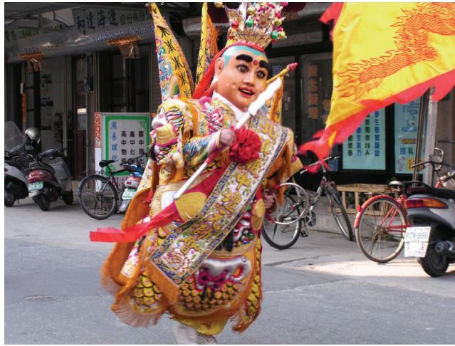
圖10-9 廟會活動中不可或缺的巨大神像。