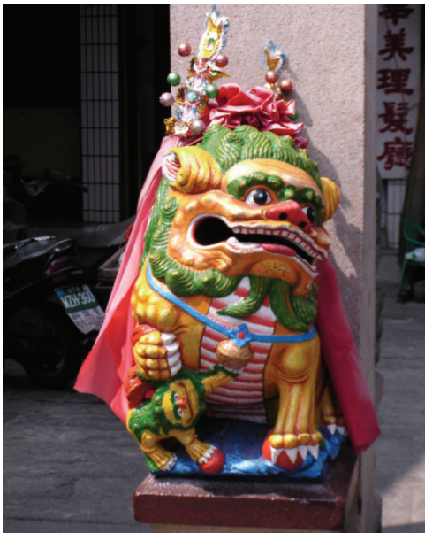
圖10-16 位於貞節牌坊下的石獅子，其中一座被稱為「虎仙姑」，據傳有靈性且其靈誕為中秋節。

灰砂公：後浦南門許氏高陽堂後，有灰砂古塚，後該地形成市廛，因作小廟二尺許，供奉為灰砂公。