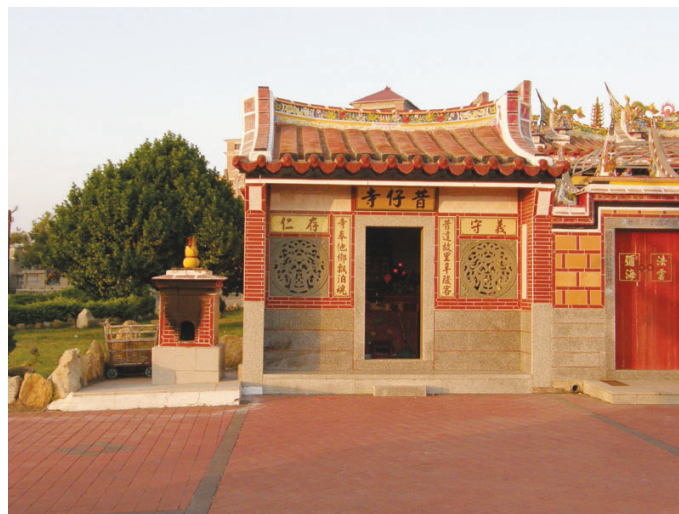
圖10-12 水頭的「昔仔宮」是少數為了出洋客孤魂所建之宮廟。