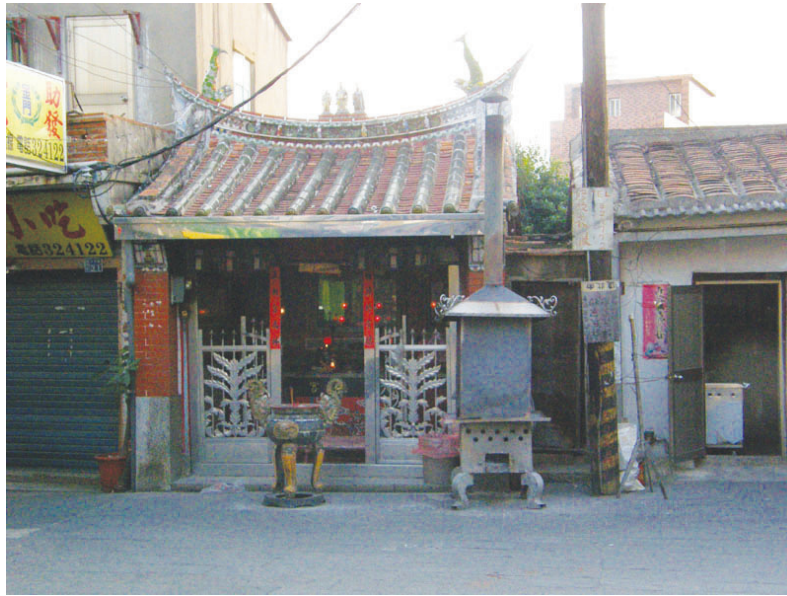
圖10-13 土地公(福德正神)最為普遍之神社，圖為後浦街頭的土地廟，地方上稱為「南北西街的土地廟」。

竈神：竈，今字多簡為灶。俗稱司灶君，灶君公，或灶王爺，為守灶之神。其祀甚古，古周禮說載：「顓頊氏有小日黎，為祝融，祀以為灶神。」禮記月令：「孟夏之月，甚祀灶，祭先肺。」西陽雜俎諾皋記上：「灶君名隗，狀如美女。又姓張名單，字子郭，夫人字卿忌，有六女，皆名察治。常以月晦日上天白人罪惡，大者奪紀，紀三百日，子者奪算，算一百日，故為天帝督使，下為地精，己丑日日出卯時上天，禹下行署，此日祭得福。」吾人塑像奉祀於家堂佛龕觀音之左，八月初三日為其誕辰。