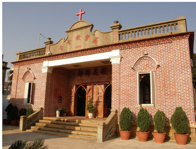
圖10-3 外觀溫馨的基督教堂是一棟年代久遠的建築。

基督徒相信上帝是三位一體：聖父是萬有之源造物之主、聖子是太初之道而降世為人的耶穌基督、聖神受聖父之差遣運行于萬有之中，更受聖父及聖子之差遣而運行於教會之中。但這三者仍是同一位上帝，而非三個上帝。但是，否認三位一體的則例外，當中可能包括一位一體論、三位三體論、形態論等等。